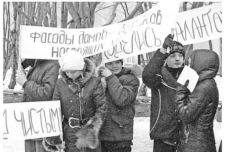
На митинг ребята вышли под девизом «Чистый мир – белая душа!».