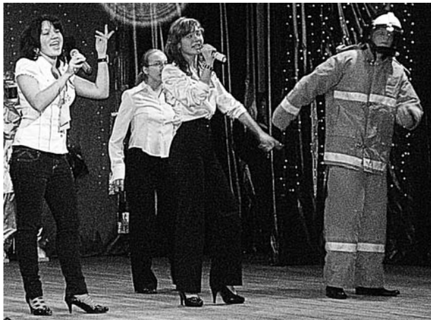
«Досталась им опасная работа - борьба с огнем, стоящим на пути...»

Строгое жюри оценивало участников по пятибалльной шкале. И они признались, что сложно было выделить лучших. Тем не менее,