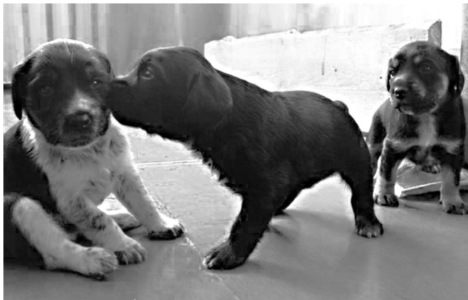
«Представляешь, а у нас-то еще два черноухих брата!»