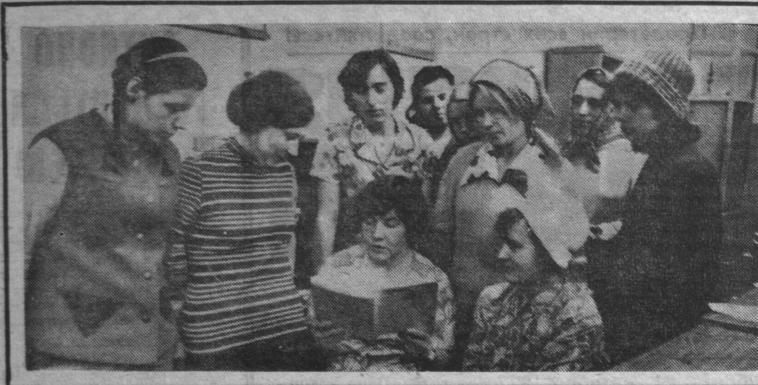
На предприятиях и в учреждениях города Североморска и пригородной зоны продолжается обсуждение проекта Конституции СССР.