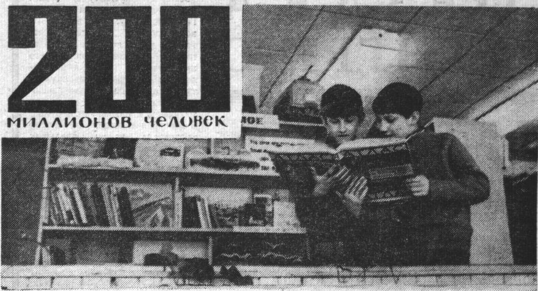
В Североморской Центральной детской библиотеке.

В СССР БЕСПЛАТНО ПОЛЬЗУЮТСЯ БИБЛИОТЕКАМИ СВЫШЕ