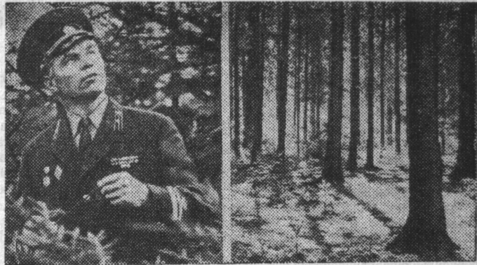
«Граждане СССР обязаны беречь природу, охранять ее богатства».

Н. ЦМОКОВ, гл. инженер управления коммунального хозяйства Североморского горисполкома.