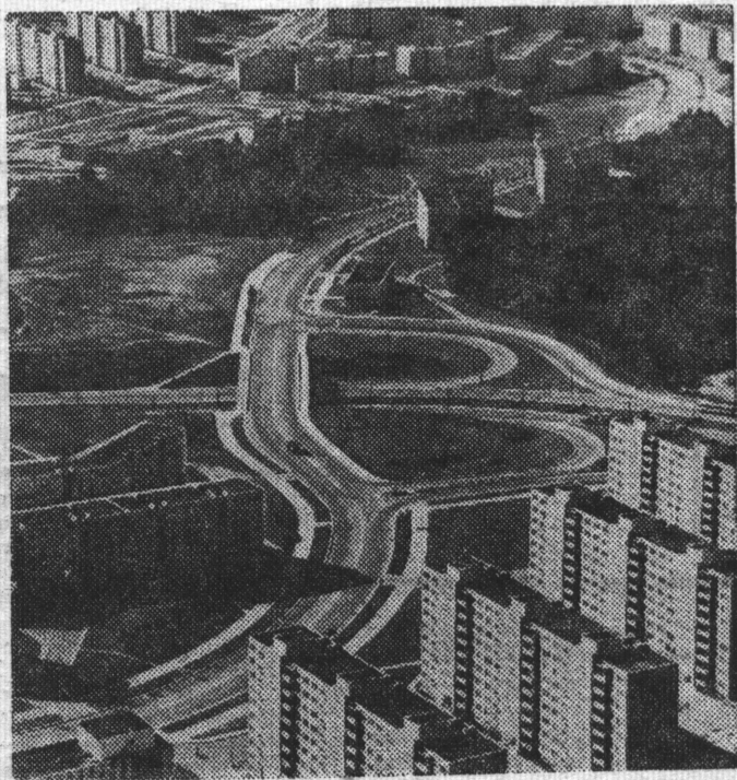
ЛИТОВСКАЯ ССР. Столица Литовской ССР — Вильнюс. Новые жилые кварталы в районе Лаздынай.

Юбилейная экспозиция ярко повествует о том, что социально-экономические преобразования, осуществленные за годы Советской власти, создали фундамент, на котором выросла и успешно развивается литовская культура нового, социалистического типа, формирующая людей, в духовном облике которых главенствующими чертами являются преданность делу коммунизма, высокая гражданственность, помыслы и поступки, советский патриотизм и социалистический интернационализм.