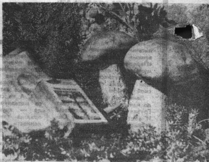
Натюрморт с грибами.

Е. ВЛАЗНЕВ, и. о. председателя городского совета ДСО «Труд».