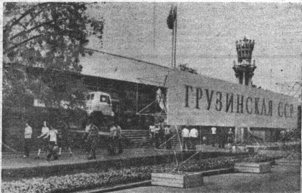
ВДНХ СССР. Павильон механизации сельского хозяйства, где размещена юбилейная выставка Грузинской ССР.

Карта рассказывает о том, как Советская власть превращает в реальность вековую мечту грузинских крестьян об осушении и освоении земель Колхиды. Здесь осушено 80 тысяч гектаров болот. На этих землях создано 44 совхоза. Ученые в содружестве со специалистами сельского хозяйства разработали единый план наступления на болота Колхиды, где благоприятные природные условия позволяют возделывать