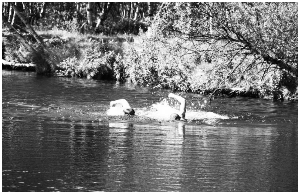
Река Средняя хоть и неглубокая, но с быстрым течением.