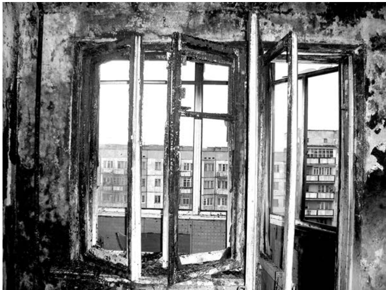
Чаще всего пожары в квартирах случаются по неосторожности жильцов. Короткое замыкание электропроводки - редкость.

Несоблюдение правил пожарной безопасности может привести не только к материальному ущербу, но и человеческой гибели. Прописная истина, похоже, известна не всем, иначе бы не выносились регулярно предписания и решения о наказании рублем. Возможно, именно увеличение размеров штрафов за такие нарушения послужит мотивом для более ответственного отношения к безопасности. Для юридических лиц предусмотрено серьезное наказание