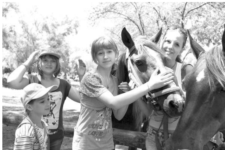
От конных прогулок в восторге были многие.