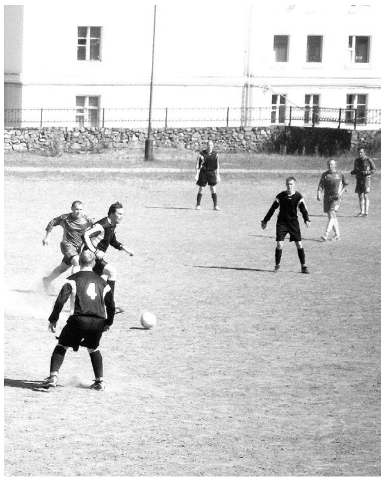
Очередное поражение не спишешь на плохое состояние поля и сильную жару. Условия равны для обоих соперников. Причина – проблемы внутри команды.