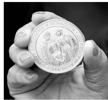
На медали «За любовь и верность» изображены св. Петр и Феврония, покровители семьи и брака.