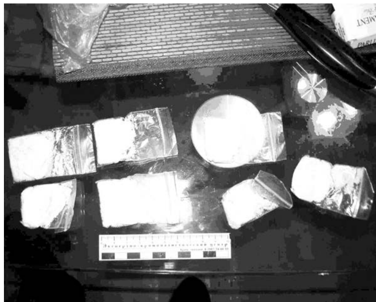
В Северноморске в этом году наркоконтроль чаще всего изымал героин, амфетамин и так называемый бутират.

У нас зафиксированы случаи оборота дезоморфина. В прошлом году - 8 изъятий, в первой половине 2011 года - также 8. Рост есть, но не такой, как в других регионах. С начала года ликвидировано 3 дезоморфино-