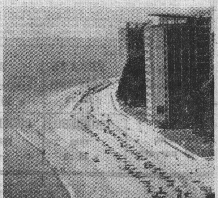
НА СНИМКЕ: черноморская здравница Пицунда.