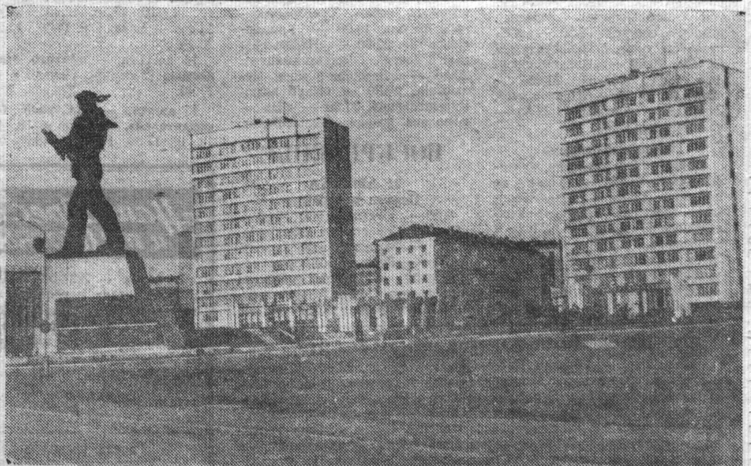
г. Североморск, Приморская площадь.