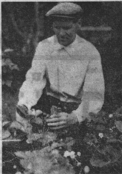
Чувствую тогда — снова на родине, у себя на архангельщине.

— Знаете, когда здесь, в саду, особенно хорошо? Летом, перед дождем.