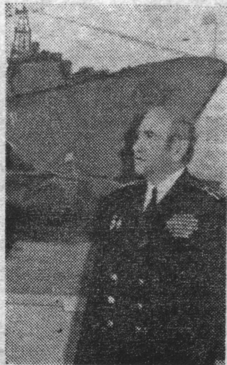
занимал различные командные должности на Краснознаменном Северном флоте. Член КПСС с 1942 года.