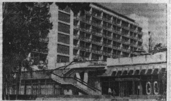
Хорошеет год от года город-курорт Юрмала. К услугам отдыхающих многочисленные санатории, пансионаты, дома отдыха. Недавно здесь вступила в строй новая гостиница «Юрмала» на 375 мест (на снимке).

Путевки — льготные. Подавляющему большинству работников они продаются за 30 процентов стоимости. Остальное оплачивается из фонда социального страхования и заводского фонда, предназначенного на социально-культурные мероприятия. За год предприятия и профсоюз расходуют на эти цели примерно 300 тысяч рублей. Фонды постоянно растут. Увеличиваются, следовательно, и число людей, пользующихся льготными путевками.