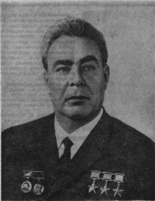
Генеральный секретарь ЦК КПСС, Председатель Президиума Верховного Совета СССР товарищ Леонид Ильич БРЕЖНЕВ.