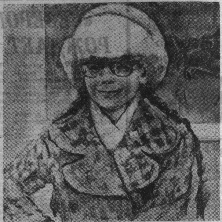
дрых художников Кольского края есть интересные таланты, люди, увлеченные творчеством, ищущие свой путь в искусстве. В. СМЕРНОВ.

В целом выставка свидетельствует о том, что среди моло-