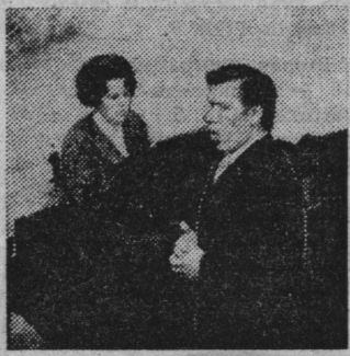
О заключительном концерте праздника искусств «Североморская весна»