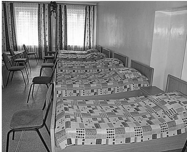
Одна из отремонтированных спален общеобразовательной школы-интерната.