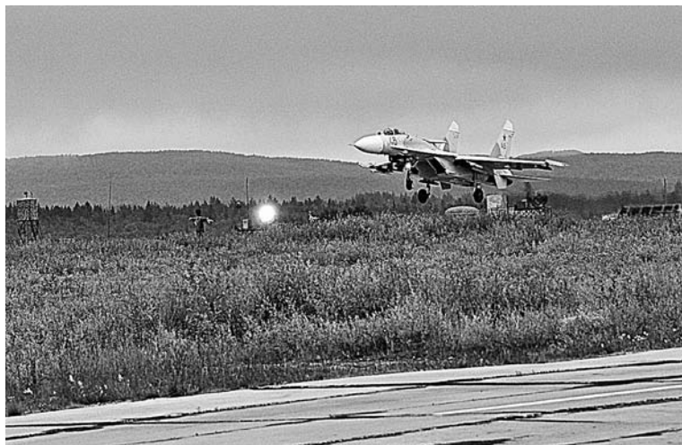
Гордость российского воздушного флота - истребитель Су-27.

- Наша бригада уже работает в структуре нового облика – вместо корпуса ПВО мы преобразованы в бригаду воздушно-космической обороны, в своем составе имеем истребительные авиационные, зенитные ракетные и радиотехнические полки. Авиационные полки в скором времени бу-