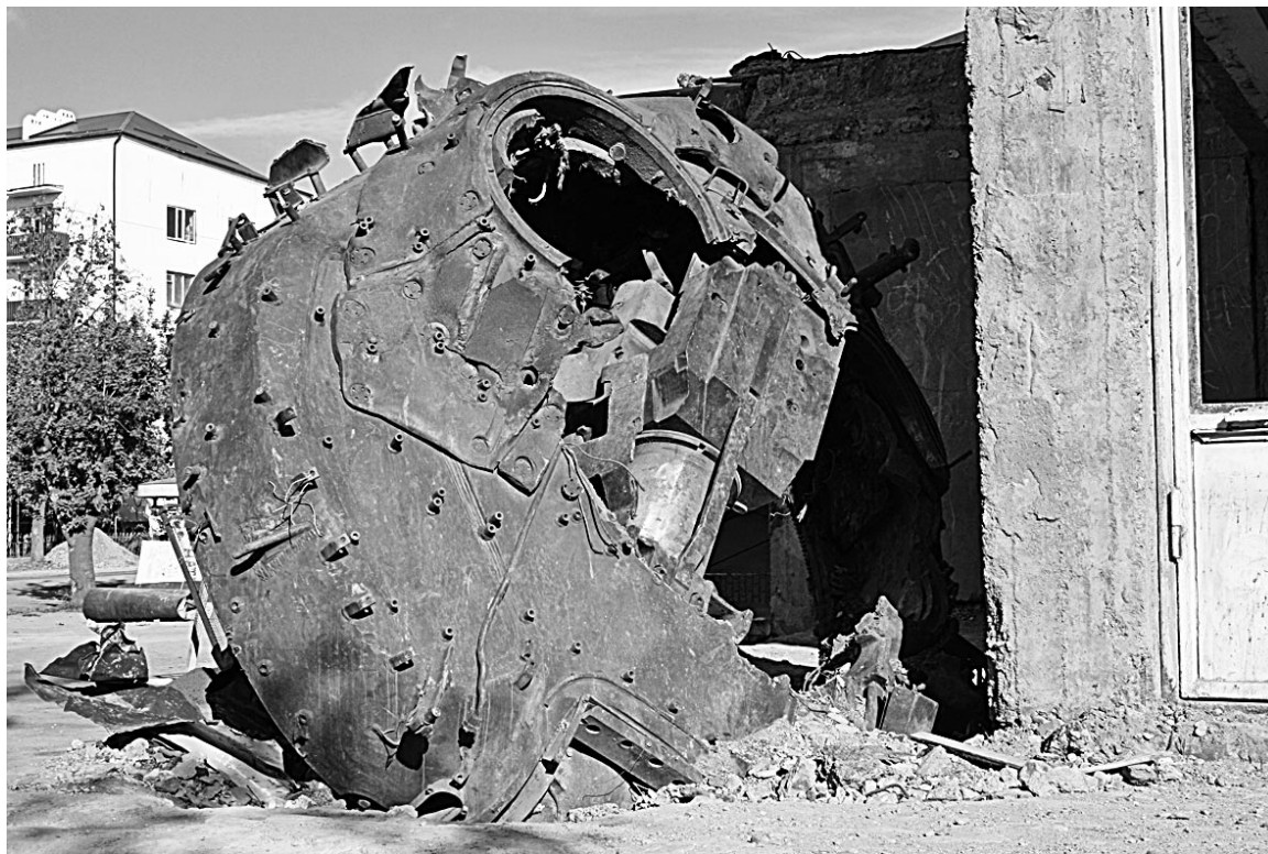
Башня грузинского танка как напоминание о войне.

Валерий КАЗАНОВ. Воронеж — Цхинвал — Воронеж.