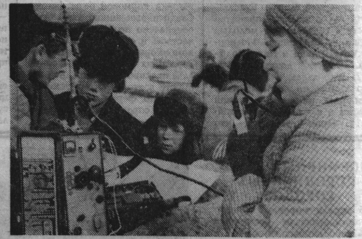
На снимках: эпизоды игры «Зарница».