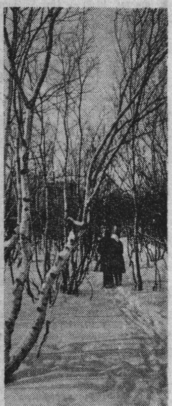
В городском парке.