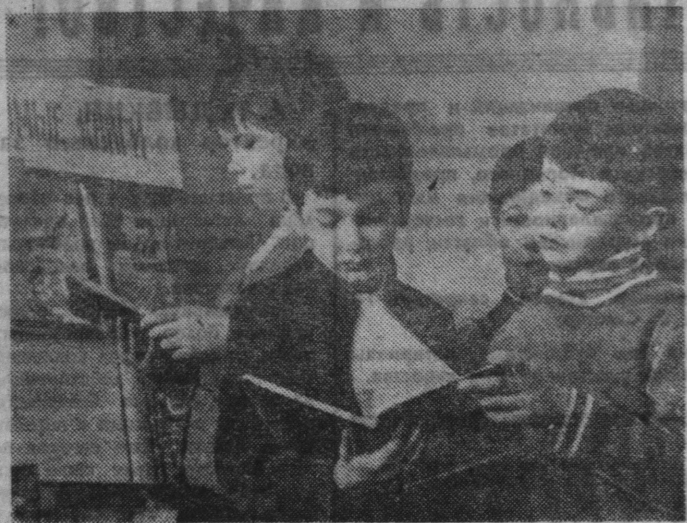
НАВСТРЕЧУ 60-ЛЕТИЮ ОКТЯБРЯ