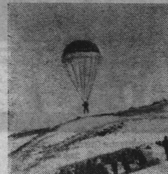
На снимках: эпизоды праздника «Проводов русской зимы».