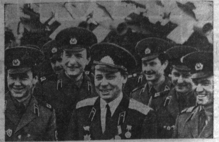
История войск противовоздушной обороны страны полна славных героических дел.

В годы Великой Отечественной войны зенитчики уничтожили свыше 7000 фашистских самолетов, более 1000 танков и много вражеской живой силы.