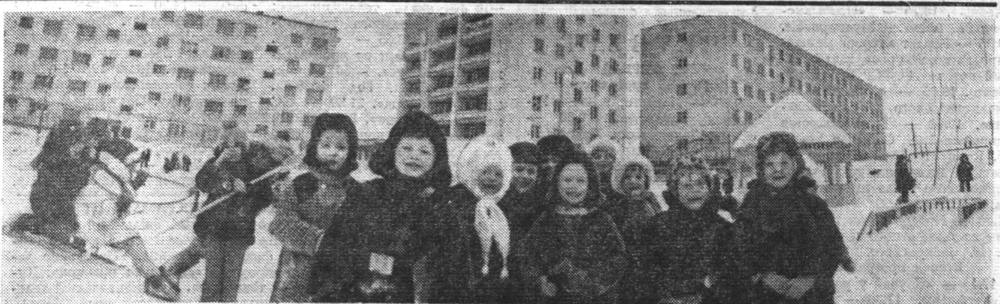
Детский сад на прогулке.