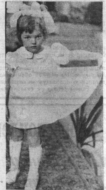
Редактор В. С. МАЛЬЦЕВ.