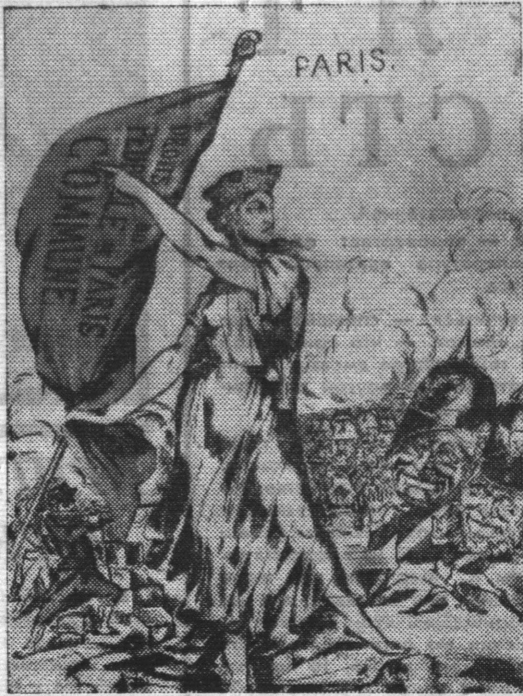
На снимке: плакат Коммуны «Я хочу быть свободной! Это мое право, и я защищаюсь». Художник В. Алексис. Из фондов Музея К. Маркса и Ф. Энгельса.

Октябрьская революция, как продолжение дела Коммуны, в огромной степени обогатила ее опыт, довела дело коммунаров до победного конца и стала исходным рубежом современного международного рабочего и коммунистического движения. В этом году День Парижской Коммуны отмечается в канун 60-летнего юбилея Великой Октябрьской социалистической революции. Опыт Коммуны в нашу эпоху многократно обобщен и умножен. В памяти всего прогрессивного человечества навсегда сохранится живой и воодушевляющий облик парижских коммунаров.