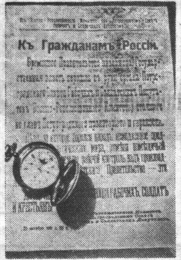
Навстречу 60-летию Октября