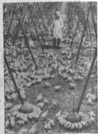
Сельское хозяйство республики в нынешней пятилетке будет развиваться по пути специализации и концентрации, создания межколхозных объединений, внедрения новой техники.

За годы десятой пятилетки на Вильнюсской птицефабрике рост производства составит более 30 процентов. Коллектив предприятия обязался за это время произвести 30 тысяч тонн мяса.