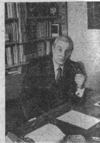
Миллионными тиражами идет из печати произведение Героя Социалистического Труда, народного поэта Литовской ССР лауреата Ленинской премии Эдуардаса Межелайтиса. Его книги издаются на многих языках. Книги Э. Межелайтиса — «Алелиюмай», «Авиаскизы», «Контрапункт», «Пантомима» и «Монодрама» — творческая биография поэта. В них собраны и ранние произведения Межелайтиса, и зрелые, где он размышляет о призвании и долге поэта.