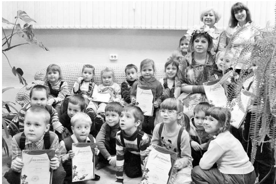
Для малышей из детского сада №12 библиотечный конкурс - это настоящий выход в свет.

Сотрудники библиотеки подошли к открытию выставки творчески, позвав настоящую Осень в наряде из листьев, которая загадывала малышам