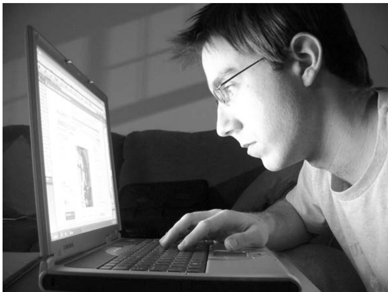
При работе за компьютером в темноте нагрузка на зрительный аппарат значительно возрастает.

Во первых, обязательно должен быть режим отдыха для глаз. Нужно постараться снизить зрительные нагрузки, хотя сделать это порой сложно: у многих работа связана с компьютером. Особенно утоми-