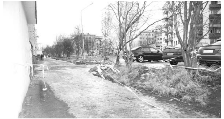
Лента в «Ваенге», видимо, закончилась - теперь путь пешеходам преграждает неопрятного вида веревка.

Хорошая все-таки вещь оградительная лента. Нет у ремонтных служб возможности устранить неполадку немедленно – огораживают опасный участок, и люди обходят это место стороной.