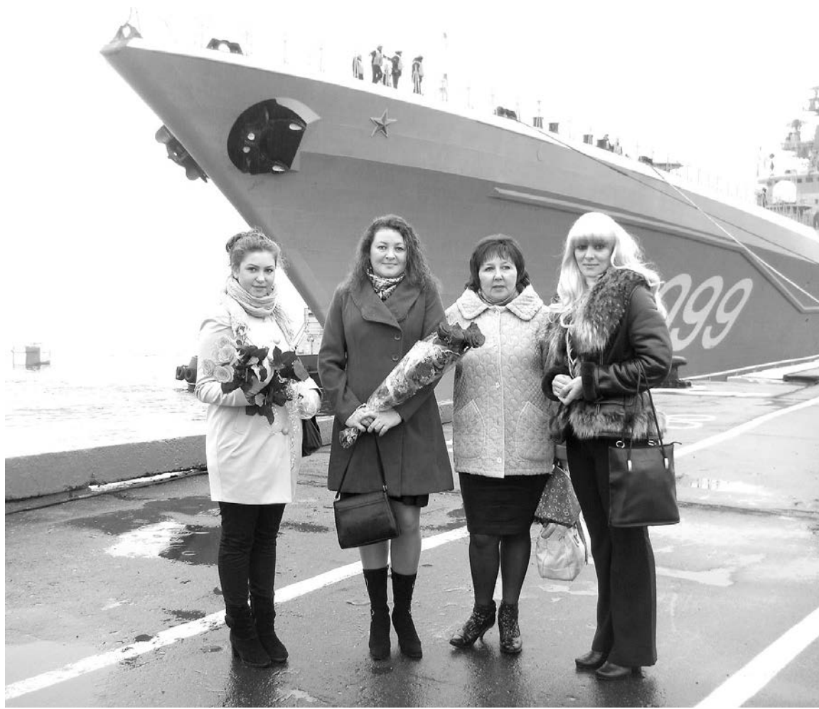
В любую погоду женсоветы готовы организовать торжественную встречу кораблей, вернувшихся из похода.

Наталья СТОЛЯРОВА.