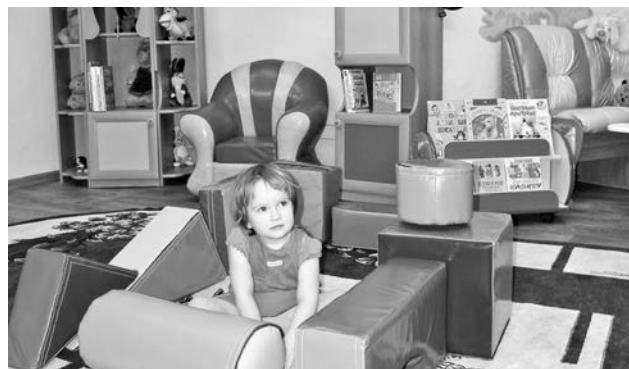
Разместить детский центр удалось, высвободив и отремонтировав старое книгохранилище.

ления культуры и международных связей Ириной Нориной поздравить библиотечарей с этим собы-