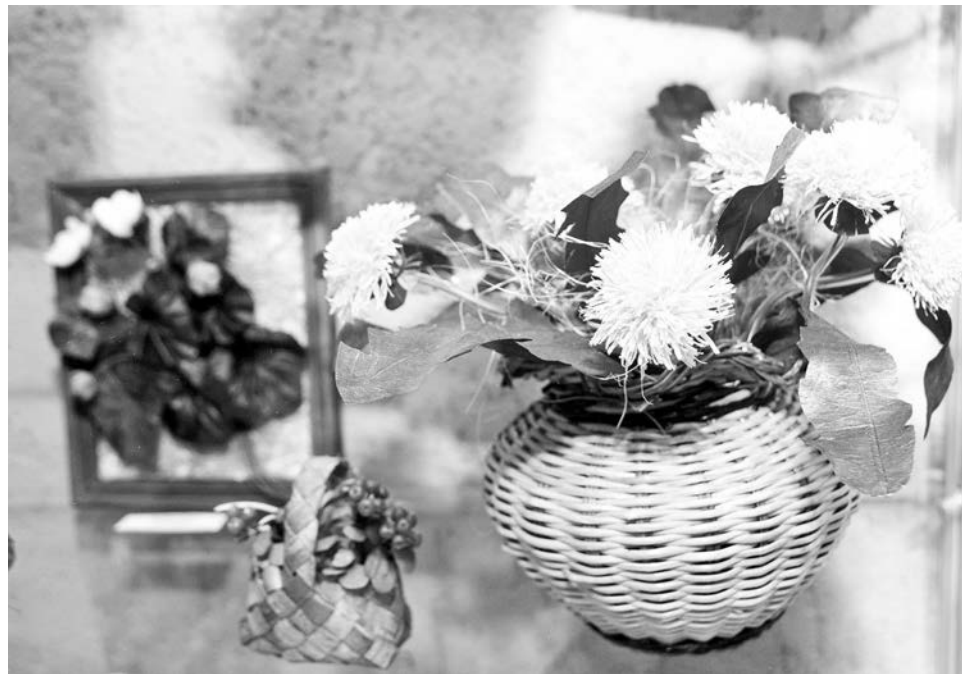
Цветы и ягоды, созданные руками мастериц, выглядят совсем как живые.

Центральная городская библиотека оправдывает звание культурного центра города. В будни и выходные здесь кипит жизнь: проводятся встречи, литературные вечера и прочие мероприятия. В субботу в стенах библиотеки открылись сразу три выставки.