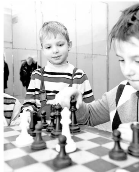
Шахматы – спорт и для взрослых, и для детворы.