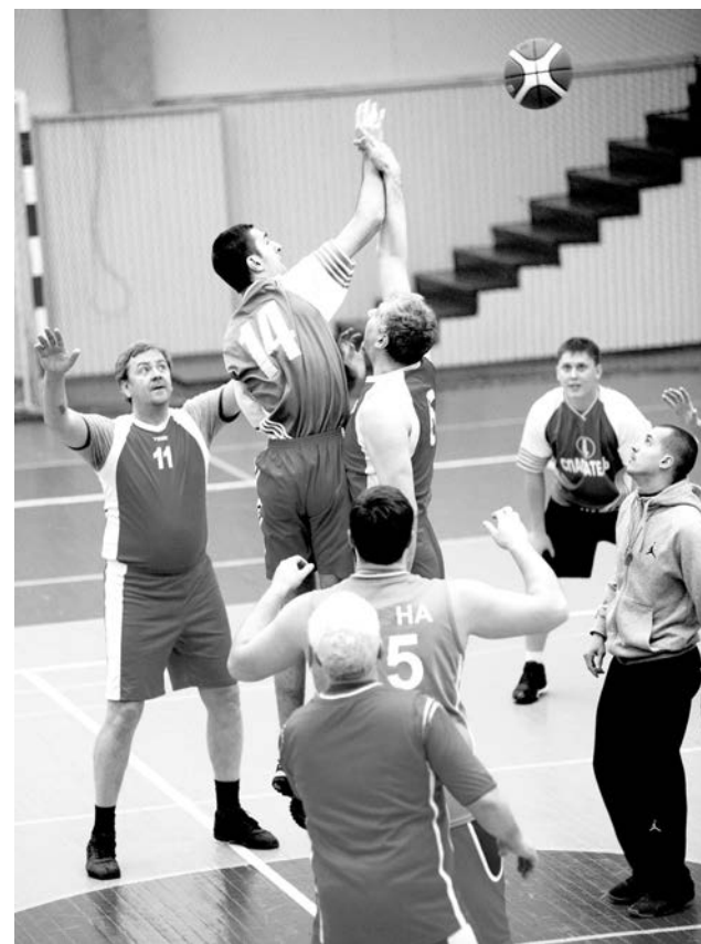
В борьбе за мяч «спасатели» были проворнее «ветеранов».