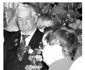
Североморских ветеранов традиционно чествовали в кафе «Урзу».