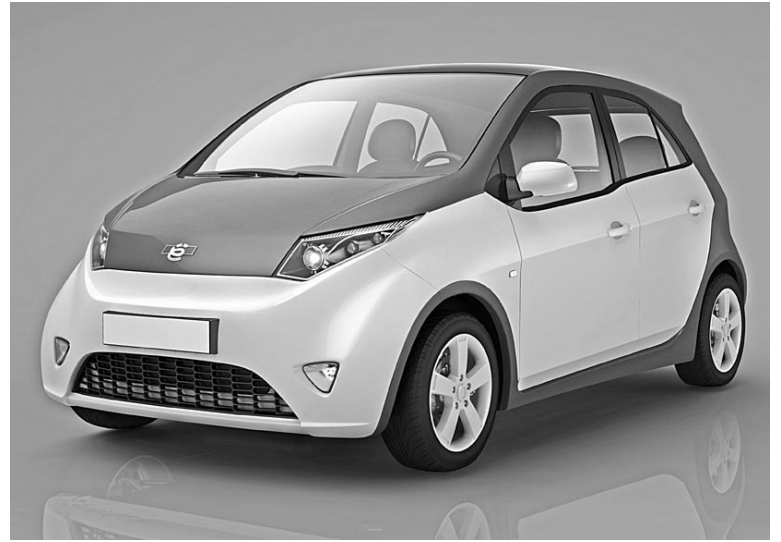
40 первых «Ё-мобилей» для тест-драйвов планируется выпустить уже в этом году.

В качестве топлива подойдет бензин или газ – пропан-бутановая смесь или метан. Основной источник энергии – роторно-лопастной двигатель внутреннего сгорания, работающий совместно с электрогенератором. Ток аккумулируется в накопителе (суперконденсаторе) и питает два ведущих электромотора (один для передней оси и один для задней), вращающих колеса через дифференциалы и реализуя тем самым схему постоянного полного привода. Для управления всем электрооборудованием разработана