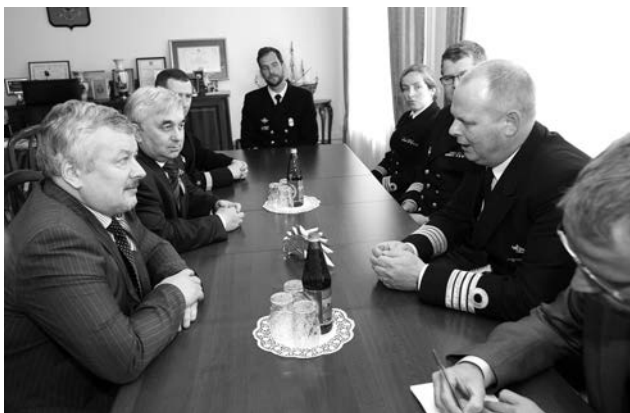
Руководство муниципалитета приняло у себя командование фрегата «Хельге Ингстад».