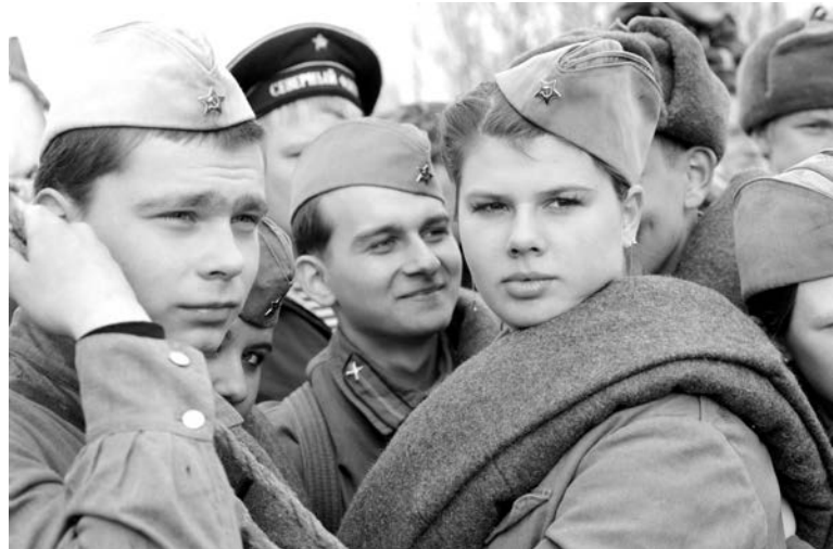
Фото с реконструкции легко можно принять за кадр из фильма или снимок военных лет.