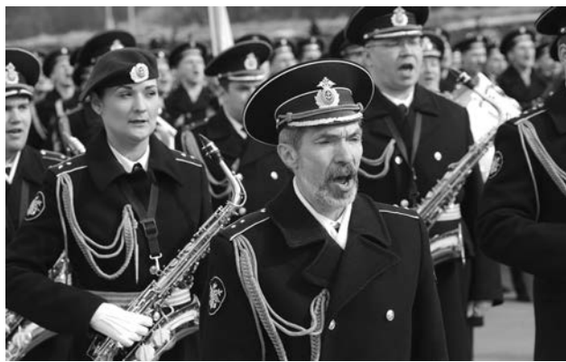
Песню «День Победы» вместе с оркестром штаба Северного флота исполняла вся площадь. Такое у нас было впервые.