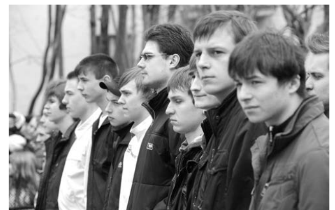
Торжественные проводы призывников-североморцев третий раз проходят в День Победы.