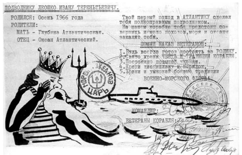
Такое же удостоверение подводника в 1966 году получил и космонавт Юрий Гагарин.