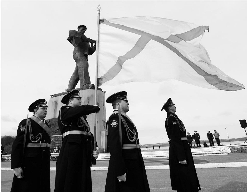
Кульминация парада - проход знаменосцев с Андреевским флагом.