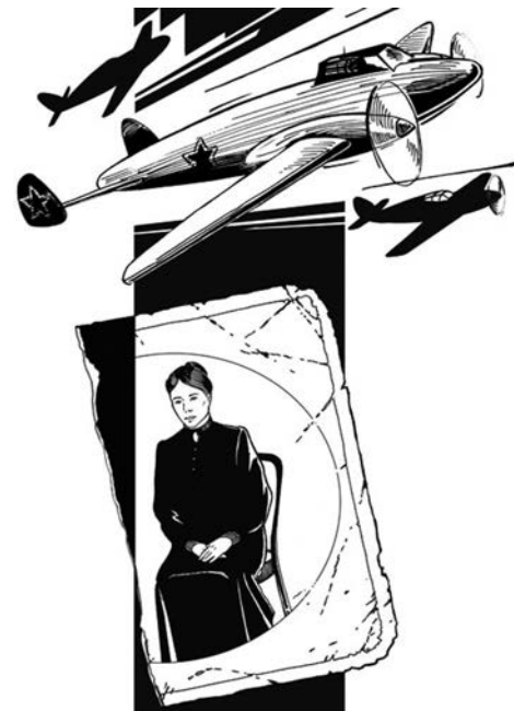
Проиллюстрировал книгу художник из Петрозаводска Дмитрий Дмитриев.

Жди меня, и я вернусь Всем смертям назло. Кто не ждал меня, тот пусть Скажет: повезло! Не понять не ждавшим им, Как среди огня Ожиданием своим Ты спасла меня.