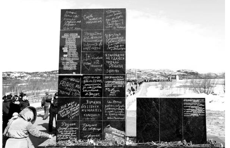
Мемориал в Долине Славы по праву считают одним из лучших памятников павшим в боях за Родину – без дежурных фраз...