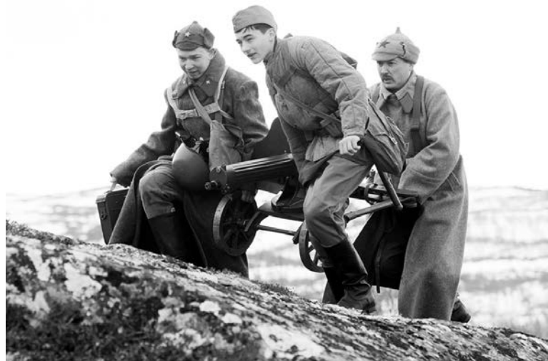
На этот раз «Заполярный рубеж» реконструировал штурм советскими солдатами высоты Круглой. Именно здесь в 1941 году Красной армией была одержана одна из первых побед в Великой Отечественной войне. Снаряжение, вооружение и форма – все отвечает духу того времени. По признанию участников «боя», это лучшая реконструкция за последнее время.

отряда им.Архангела Михаила и срочники в/ч 81265 и 63808.