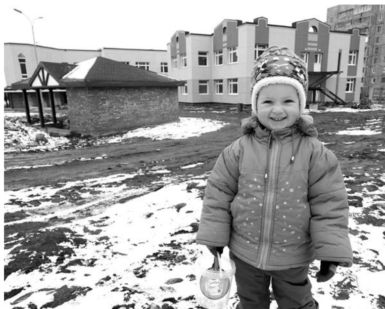
В детском саду на ул.Чабаненко будет 4 ясельных и 8 дошкольных групп.

новый комбинат будет осуществляться на коммерческой основе, Александр Абрамов развеял: