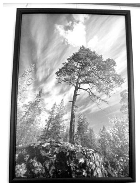
Эту статную гордую сосну автор называет «королевой леса».

На экспозиции в ЦГБ представлено 17 цветных и черно-белых фотографий из серии работ о Кольском Заполярье. Безымянные пейзажи объединены общим названием «Северное направление». Автор принципиально никак не нарекает снимки, давая волю воображению зрителей. Интересный и неорди-