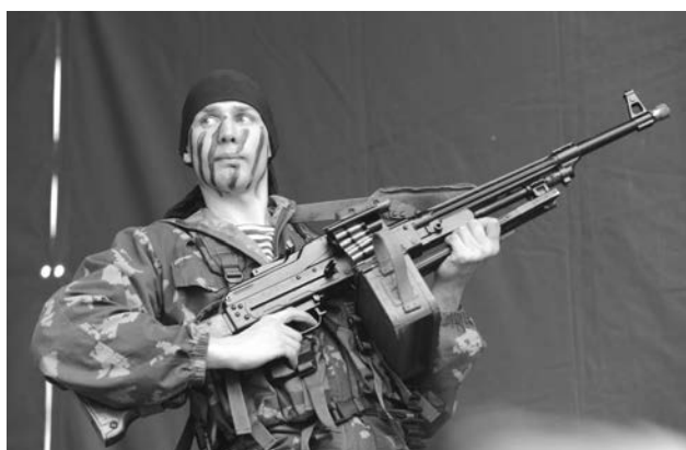
Не обошлось и без демонстрации боевой мощи морской пехоты.