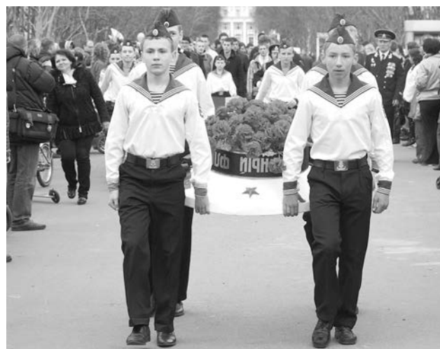
Кадеты школы-интерната прошли с символической фуражкой и георгиевской лентой по улице Сафонова, чтобы возложить цветы к памятнику Алеше. Это тоже было впервые.