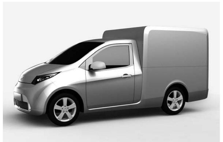
Предполагается выпуск и фургонов «Ё-мобиль».