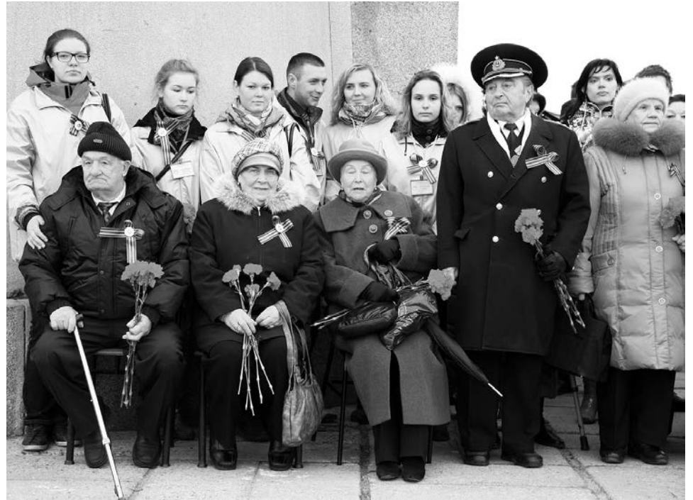
Почетное место на Параде Победы - нашим ветеранам.