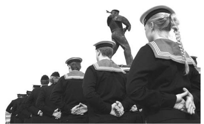
Участие в параде принял и экипаж фрегата «Хельге Ингстад». Норды легко узнаваемы даже со спины.