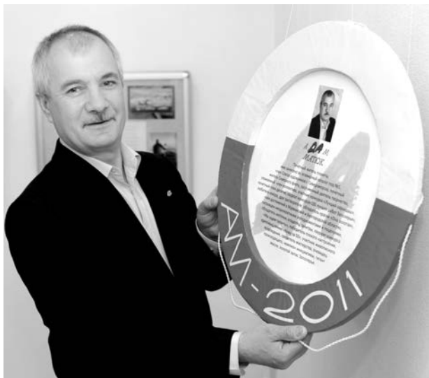
Все регалии мастера - настоящие и шуточные - хранит этот авторский спасательный круг.

«Я восемнадцать лет служил на военных кораблях, для меня это ностальгия, прекрасные светлые воспоминания. Но не только море вызывает у меня особые эмоции, я очень люблю заполярную осень, которая у нас самая яркая, красивая, самая настоя-