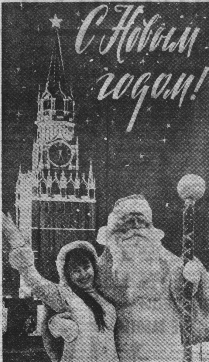
Фотоплакат В. Голуби.

Больше щедрого тепла. Мы сиянем новой славой, Алым пламенем побед — Озарим своей державы Шестьдесят заветных лет. Все, — Что мы вчера свершили, — Закрепим И утвердим. Снова взлету на вершины Новый изумленье мы дадим. Михаил ЛАРИН.