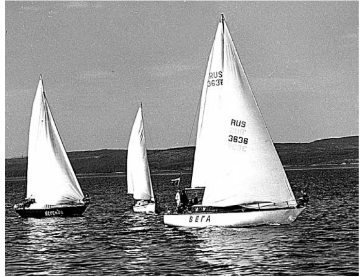
Скоро и у североморских яхтсменов появится своя стоянка для маломерных судов.

И.АЛЕКСАНДРОВА.