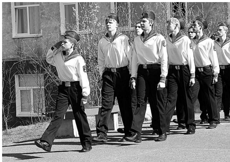
Северноморские кадеты продемонстрировали отличную выучку и музыкальность.

Завершился тематический сбор показательными выступлениями профессиональных пожарных, для этого к школе-интернату была подогнана специальная техника. Пока ребята перенимали опыт, жюри подводило итоги. Гран-при тематического сбора заслуженно достался кадетам школы-интерната. В номинации «Смотр строя и песни» отличились за-