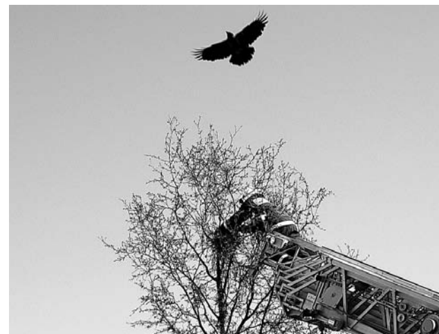
Пока пожарный освобождал ворону, самец, защищая подружку, пикировал и атаковал.