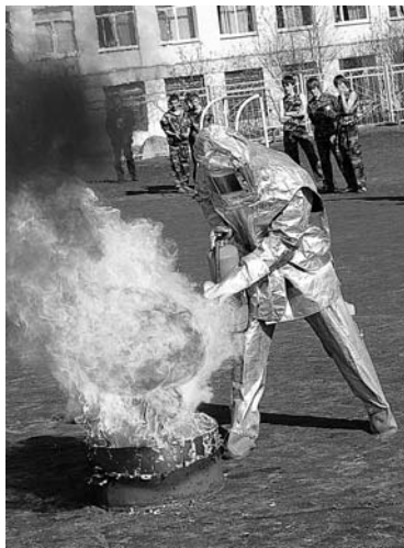
Огонь шуток не терпит, поэтому встречать его нужно во всеоружии.

зерцы, в конкурсе знатоков – гаджиевцы. Лучшими в номинации «Спасение на пожаре» стали воспитанники Детского морского центра, «Огонь – друг, огонь – враг» – школа №266 из Снежногорска, эта же команда победила в номинации «Сильнее огня наш дух». Станция «Огонь – опасная штука» стала самой удачной для полярников. Каждый участник сбора получил сертификат и ценные подарки, а победители – кубки и грамоты от Управления образования.