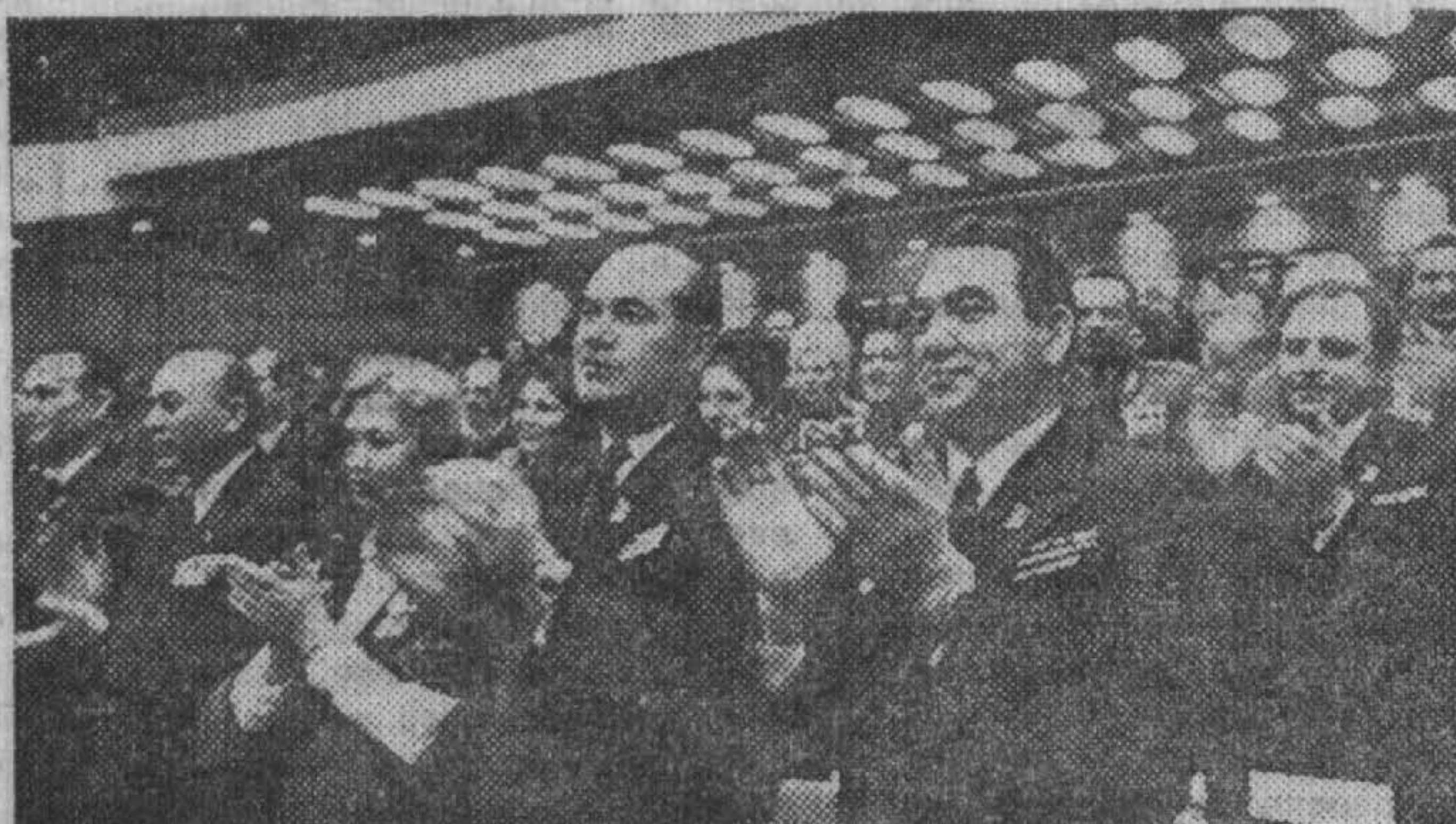
Москва. XXV съезд Коммунистической партии Советского Союза. На трибуне — Генеральный секретарь ЦК КПСС Л. И. Брежнев; на втором снимке: — делегаты съезда приветствуют Л. И. Брежнева.

Советские люди знают: там, где трудности, — там впереди коммунисты. Советские люди знают: что бы не случилось, коммунисты не подведут. Советские люди знают: там, где партия, — там успех, там победа! Народ доверяет партии. Он всецело поддерживает ее внутреннюю и внешнюю политику. И это удесятиряет силы партии, является для нее источником неисчерпаемой энергии.