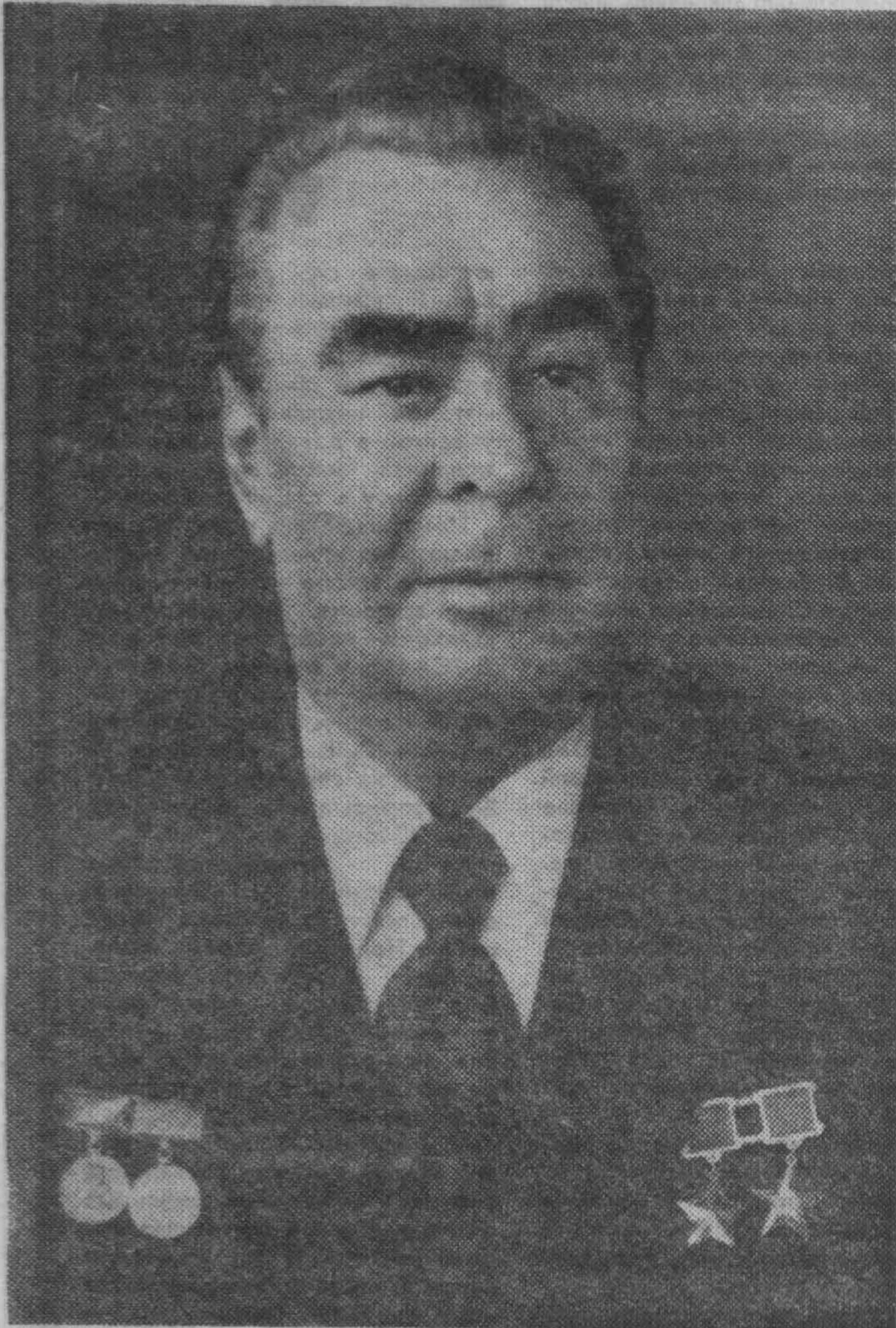
Генеральный секретарь ЦК КПСС товарищ Л. И. Брежнев.

№ 151 (725). Суббота, 18 декабря 1976 года. Цена 2 коп.