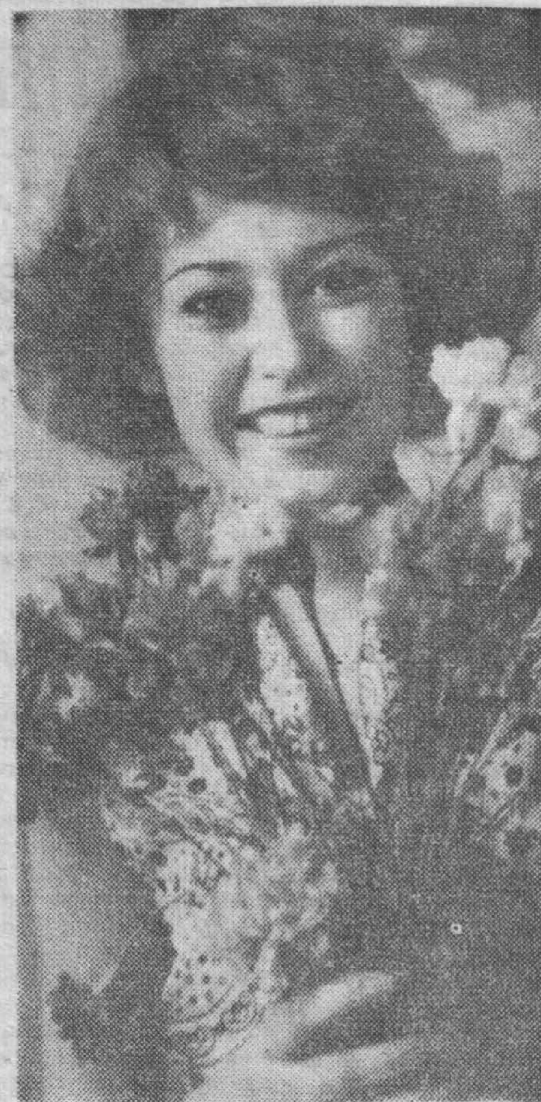
День рождения.

Чтоб снова в дом не ворвалась беда, Вы, миру поклоняясь как святыне, Не забывайте люди, никогда Кровавую трагедию Хатыни!