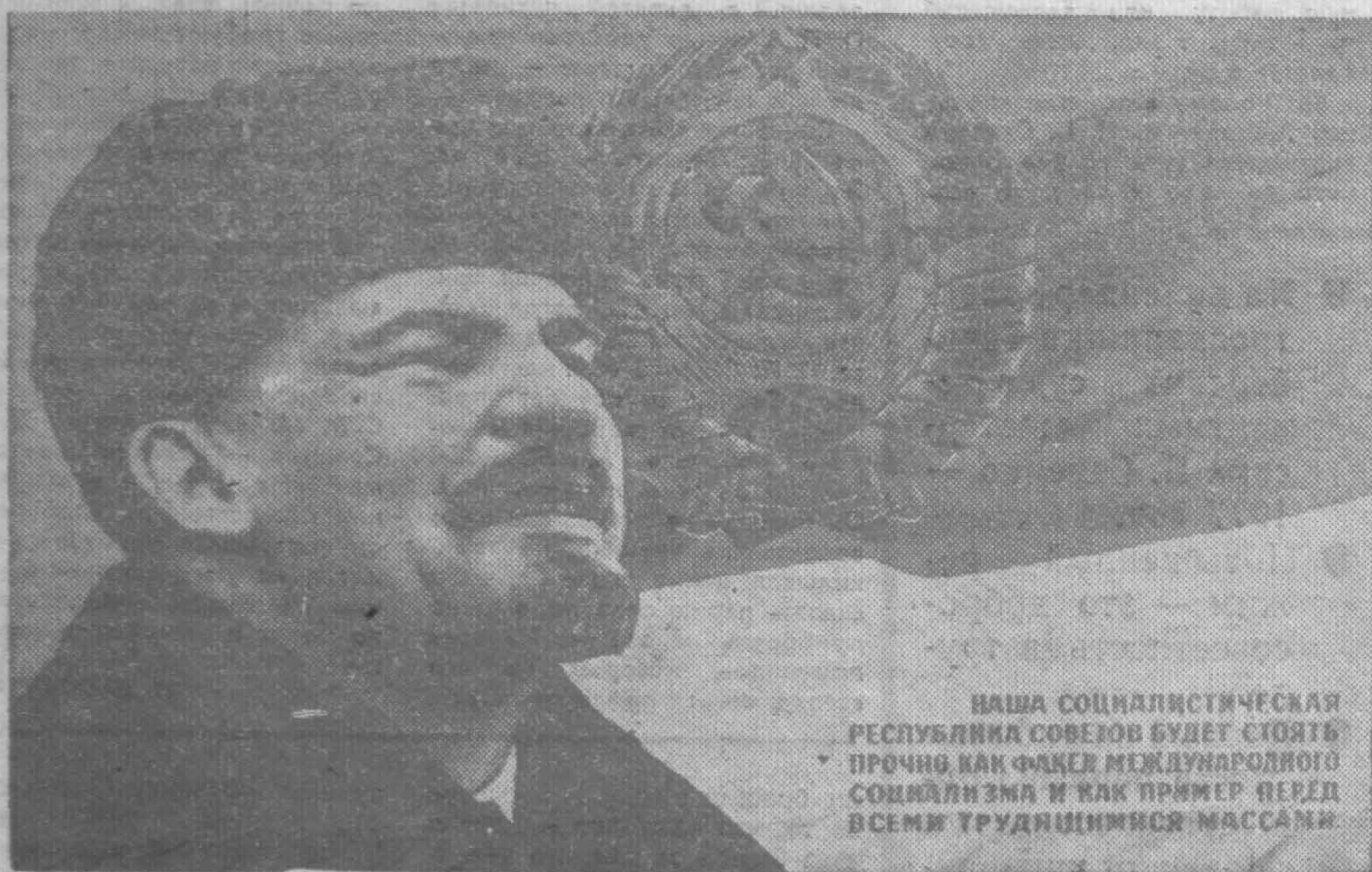
НАША СОЦИАЛИСТИЧЕСКАЯ РЕСПУБЛИКА СОВЕТОВ БУДЕТ СТОЯТЬ ПРОЧНО КАК ФАКЕЛ МЕЖДУНАРОДНОГО СОЦИАЛИЗМА И КАК ПРИМЕР ПЕРЕД ВСЕМИ ТРУДЯЩИМИСЯ МАССАМИ

Да здравствует 59-я годовщина Великой Октябрьской социалистической революции!