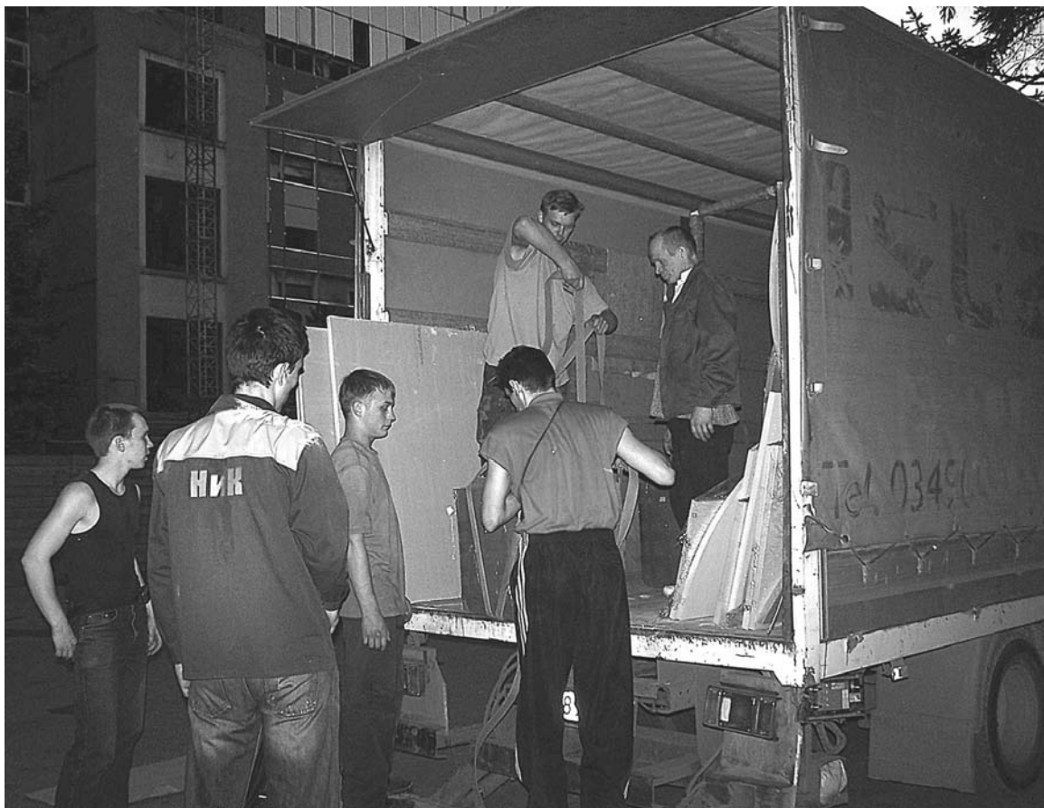
С момента подачи заявления на переселение до момента сбора вещей может пройти не один год.

Смягчены в новом положении нормы, регламентирующие право на переселение в случае смерти заявителя. Ранее супруг умершего мог рассчитывать на получение жилья только в течение двух лет со дня смерти заявителя и лишь при условии, что они совместно прожили в ЗАТО Мурманской области не менее