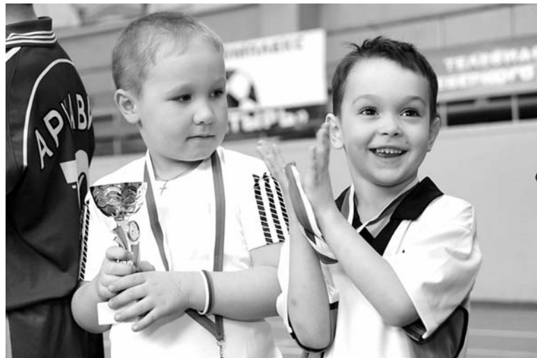
Не все награду принимают как должное - для кого-то это настоящее счастье, особенно, для малышей.

5 и 6 мая будет проводиться городская спартакиада среди допризывной молодежи. В программе соревнований: подтягивания, кросс (2 км) и плавание (50 м).