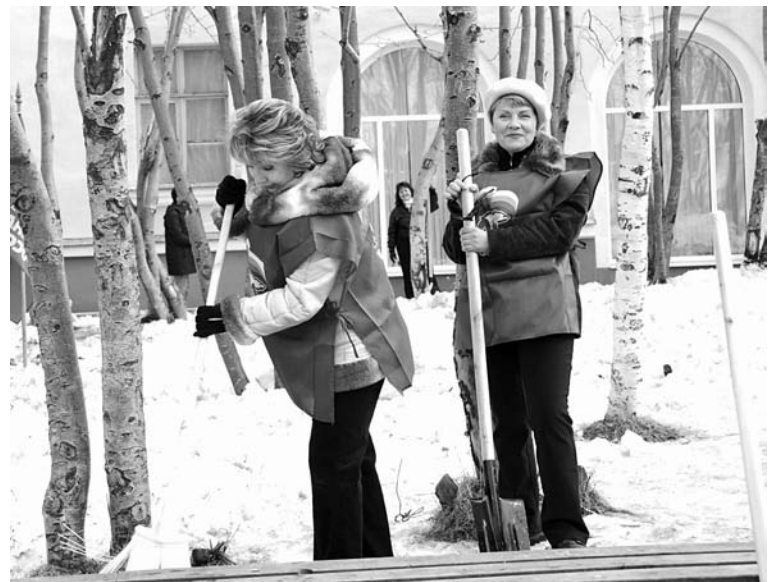
Некогда разрекламированные В.И.Лениным субботники сегодня охотно поддерживают члены «Единой России» и ЛДПР.

Как сообщили в штабе по благоустройству, по результатам первого субботника лучшими среди предприятий и организаций города стали МУП «Североморскводоканал», МУП «СПТС», МУП «СЖКХ», стоматологическая поликлиника, ЦДМ «Россия», ЖЭУ №2, СШ №9, детский сад №11. Среди торговых предприятий лучше всего потрудились работники ТЦ «Гриф», магазина «5М» и сети магазинов «Аня». Плодотворно поработали и жители