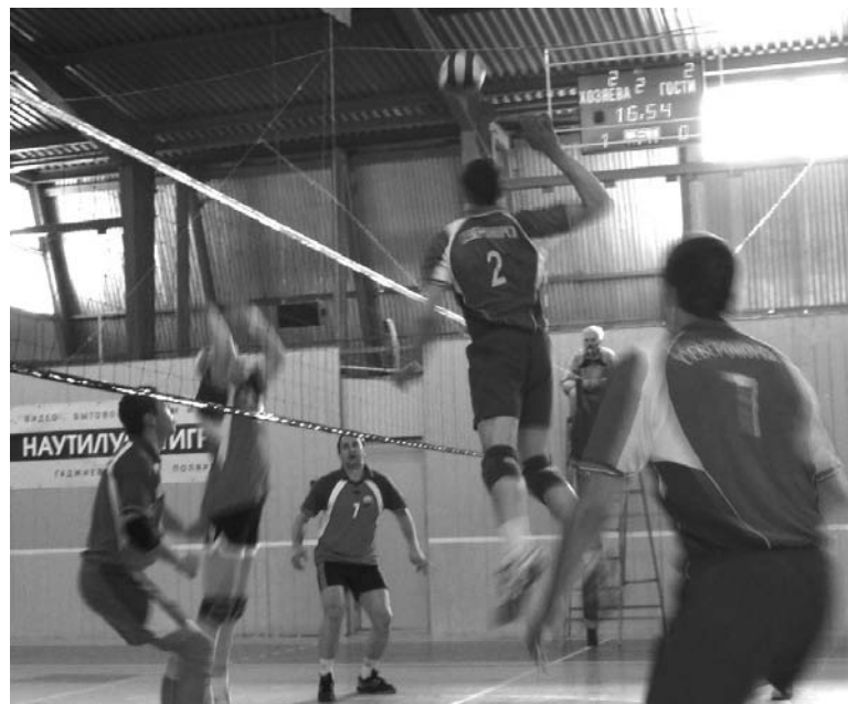
Североморцы не просто прыгают выше - у них на порядок выше уровень мастерства.