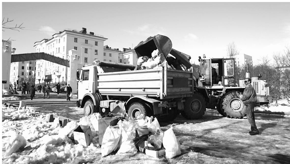
За один день было собрано и вывезено на свалку более 20 самосвалов мусора.

Сафоново, особенно служащие полка связи - теперь их поселок самый чистый.