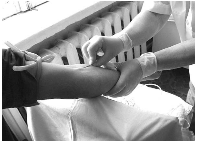
Процедура кроводачи сейчас практически безболезненна.

всего карантинизированная свежемороженая плазма требуется в родильный дом или акушерское отделение ЦРБ. Бывают ситуации, когда по какой-то конкретной группе крови мы не можем дать требуемое количество компонентов. В этом случае нам помогает Областная станция переливания крови. Например, сейчас в больнице находятся двое тяжелобольных с III группой крови положительным резусом. Все запасы крови и плазмы, которые были в отделении, мы отдали. Конечно, мы просим прийти доноров, но перерыв между дачами крови должен быть не менее двух месяцев. Поэтому приходится обращаться за помощью в область. Были в практике такие случаи, когда крови обычной, например, часто встречающейся II группы, требо-