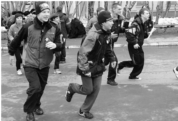
В станционной игре главное не скорость, а смекалка и сплоченность команды.