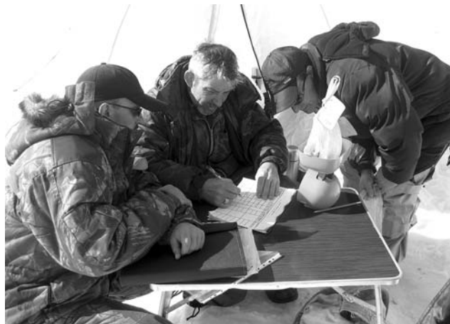
Самый ответственный момент - взвешивание. Ошибиться нельзя!