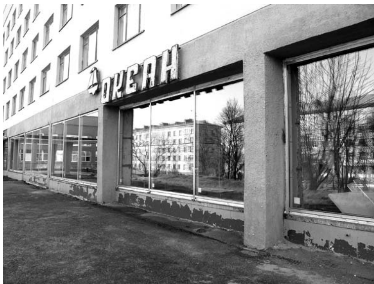
Возможно, в течение года привычная вывеска «Океан» исчезнет.

Горожане уже обратили внимание на то, что помещение бывшего ресторана «Океан» меняет свой облик. Появились новые евроокна с тонированными стеклами, да и внутри идет активный ремонт. Как сообщили в Территориальном управлении Федерального агентства по управлению государственным имуществом по Мурманской области (Росимущество), с 2004 года договор на аренду данного помещения заключен с компанией «Океан». Никаких других арендаторов не было. Рабочие, осуществляющие ремонт в помещении ресторана, также сообщили, что ремонтные работы проводит все то же ООО «Океан», а в обновленном помещении должен появиться полюбившийся мурманчанам и гостям областного центра трактир «Кружка». Правда, когда это будет, неизвестно. Работы предстоят капитальные.