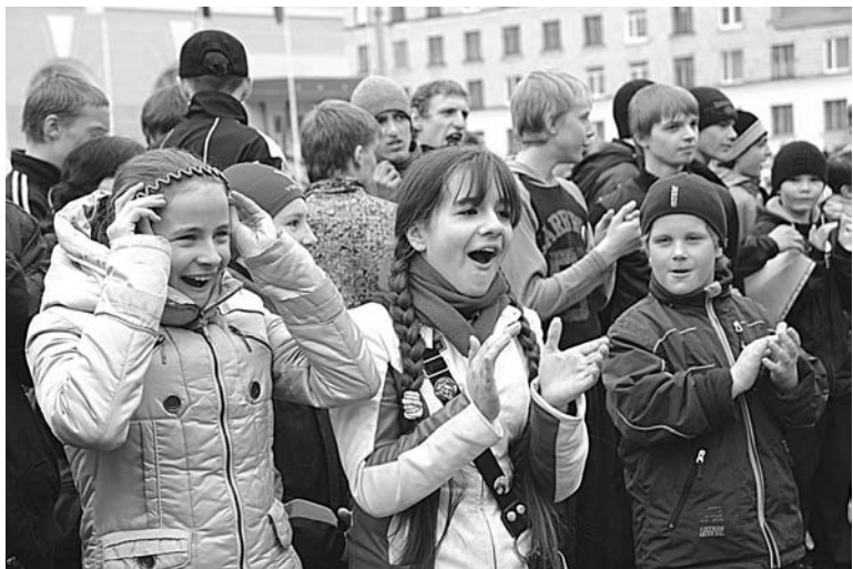
Хорошее настроение и новые друзья – лучшая награда участникам соревнования.