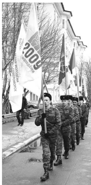
Внести знамена города, ОДМ и Года молодежи доверили победителям прошлого года – военноружащим с Окольной.