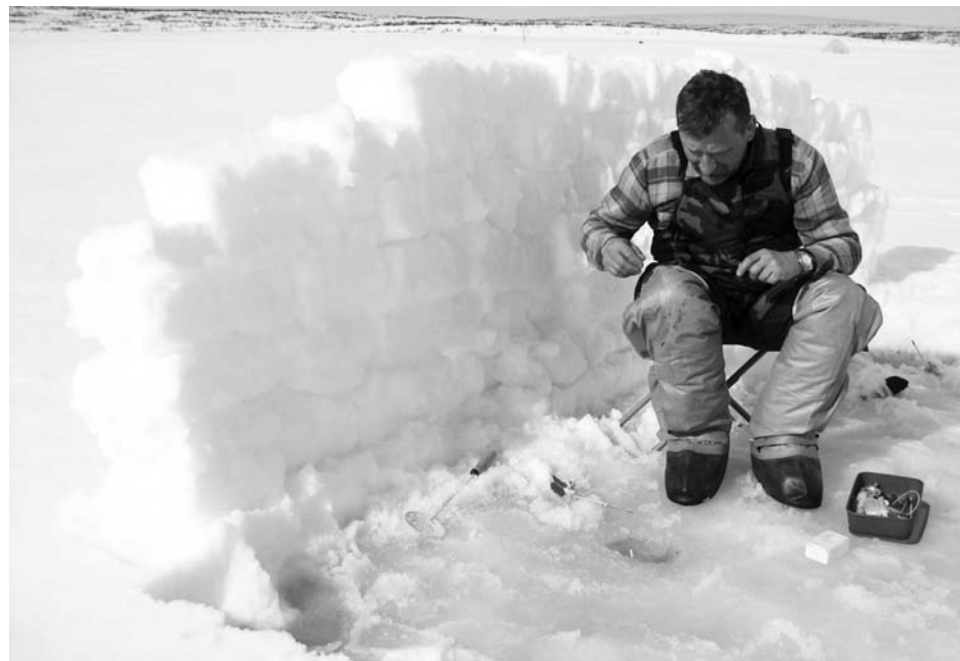
Если не клюет, примени смекалку - так хоть ветер мешать не будет.