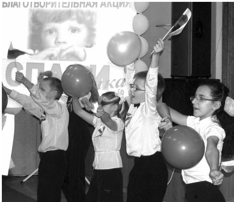
В марафоне приняли участие школьники и воспитанники детских садов – сострадание формируют с малых лет.