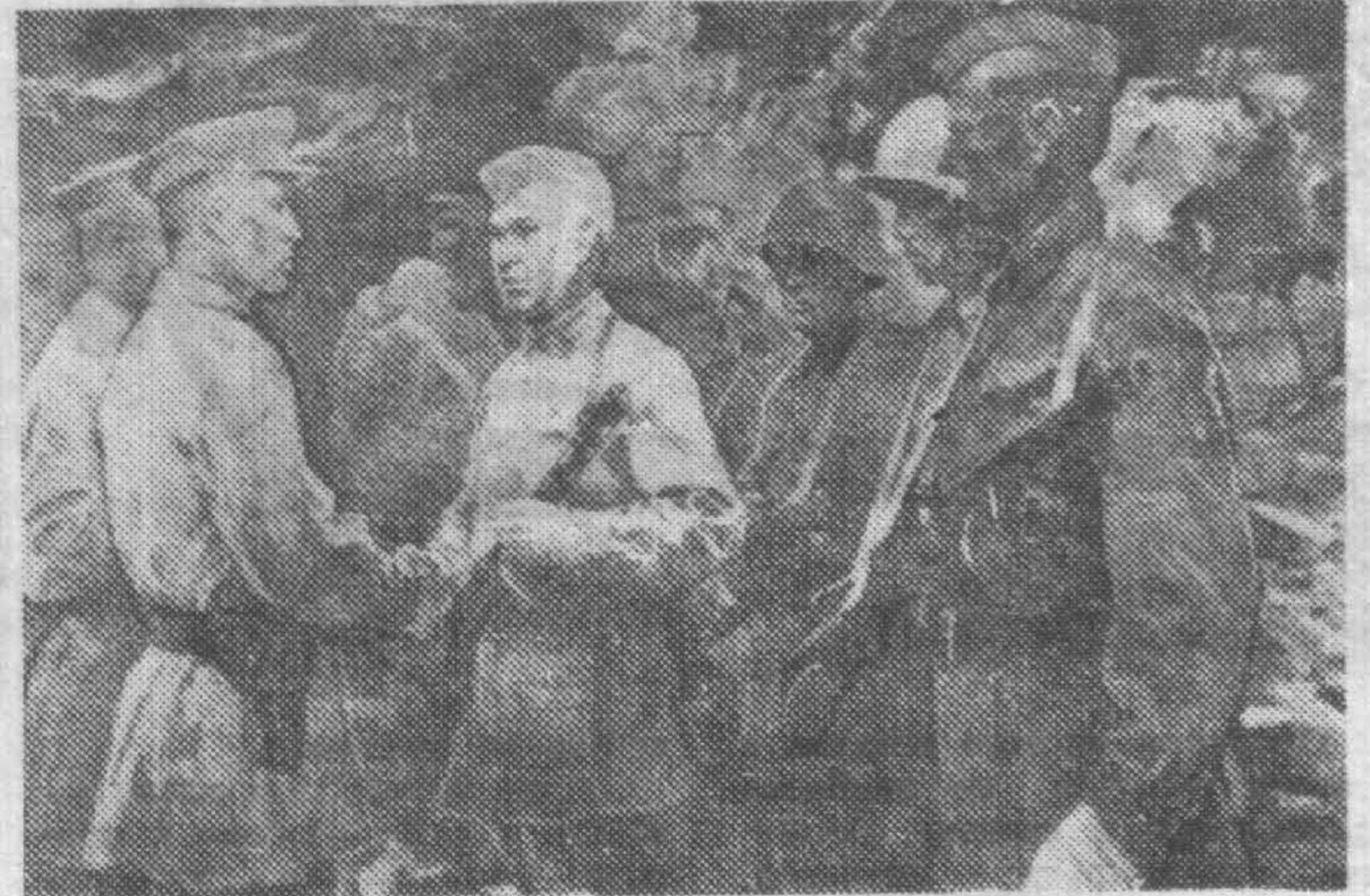
«В БОЙ — КОММУНИСТАМИ!».

В батальной сцене живописца И. Евстигнеева изображен «Ночной бой». Удачно найдено композиционное и колористическое решение этой картины: на все происходящее в данный момент, выхватываемый светом ракеты из тьмы зимней ночи, художник взглянул как бы с высоты, поэтому передний план имеет широкое пространство, которое в глубине своей сужается руслом замерзшего ручья, стиснутого с одной стороны крутым берегом и черной полосой кустарника — с другой. Подчеркнута целеустремленность бойцов, скрытно пере-