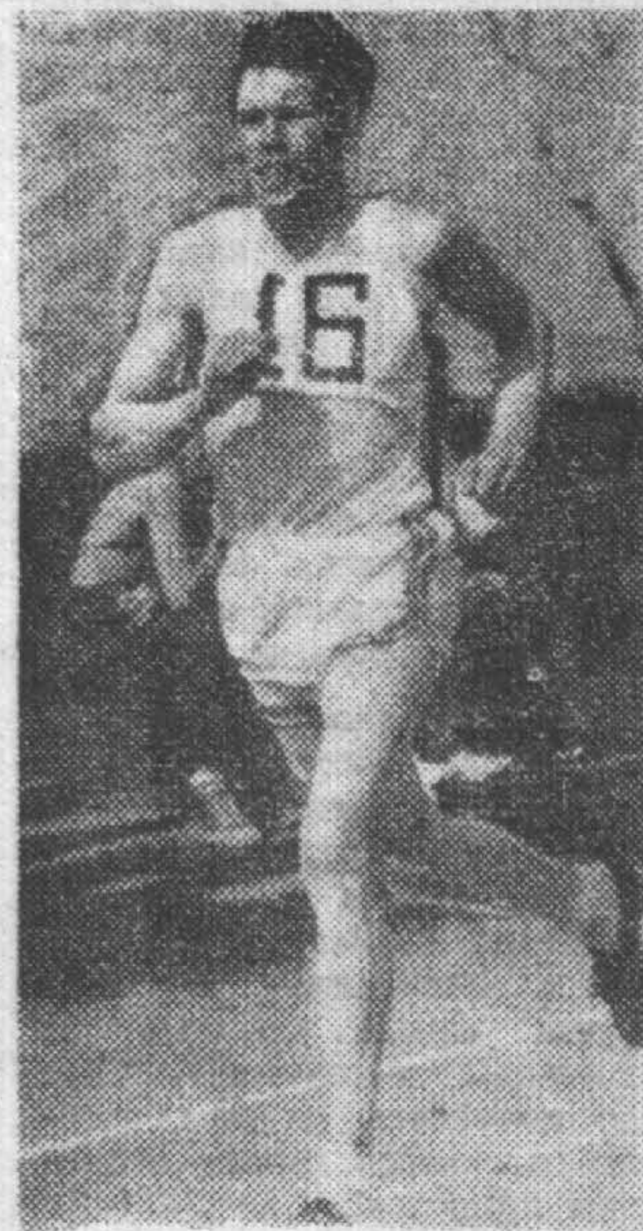
Стремление к победе.

Соревнования по многоборью ГТО еще не кончатся. С 24 по 26 сентября в Североморске состоится финал соревнований среди коллективов школ города. Просьба ко всем школьникам — принять самое активное участие в предстоящих соревнованиях.