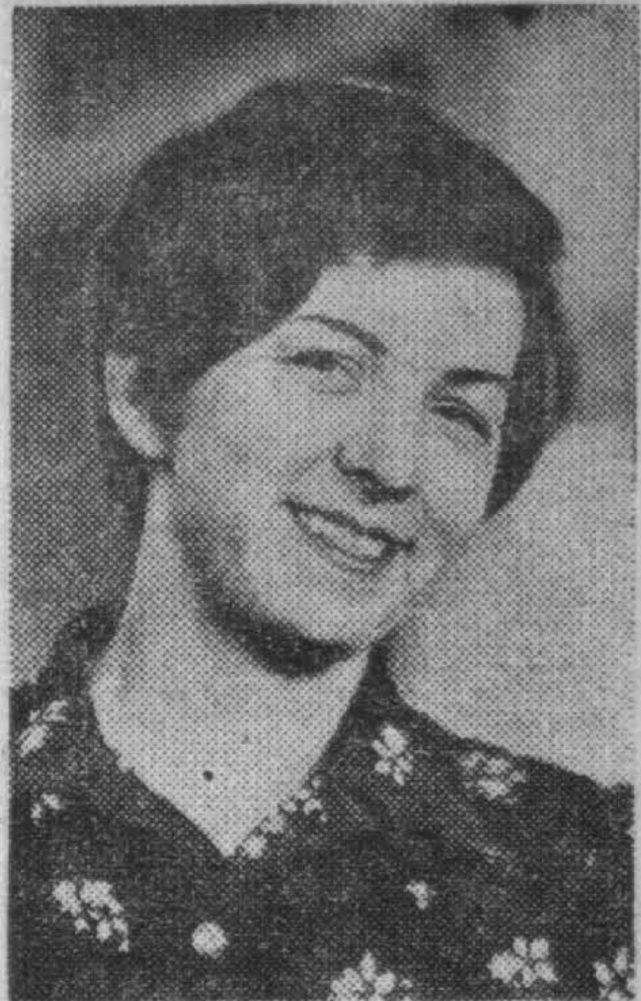
Центральный Комитет КПСС рассмотрел вопрос «О мерах по усилению развития телефонной связи страны».

Москва. Развивается сложная сеть междугородных связей. За годы девятой пятилетки протяженность междугородных телефонных каналов увеличилась вдвое. В следующем пятилетии количество междугородных каналов возрастет в 1,8 раза. Емкости телефонных станций увеличатся в 1,5 раза.