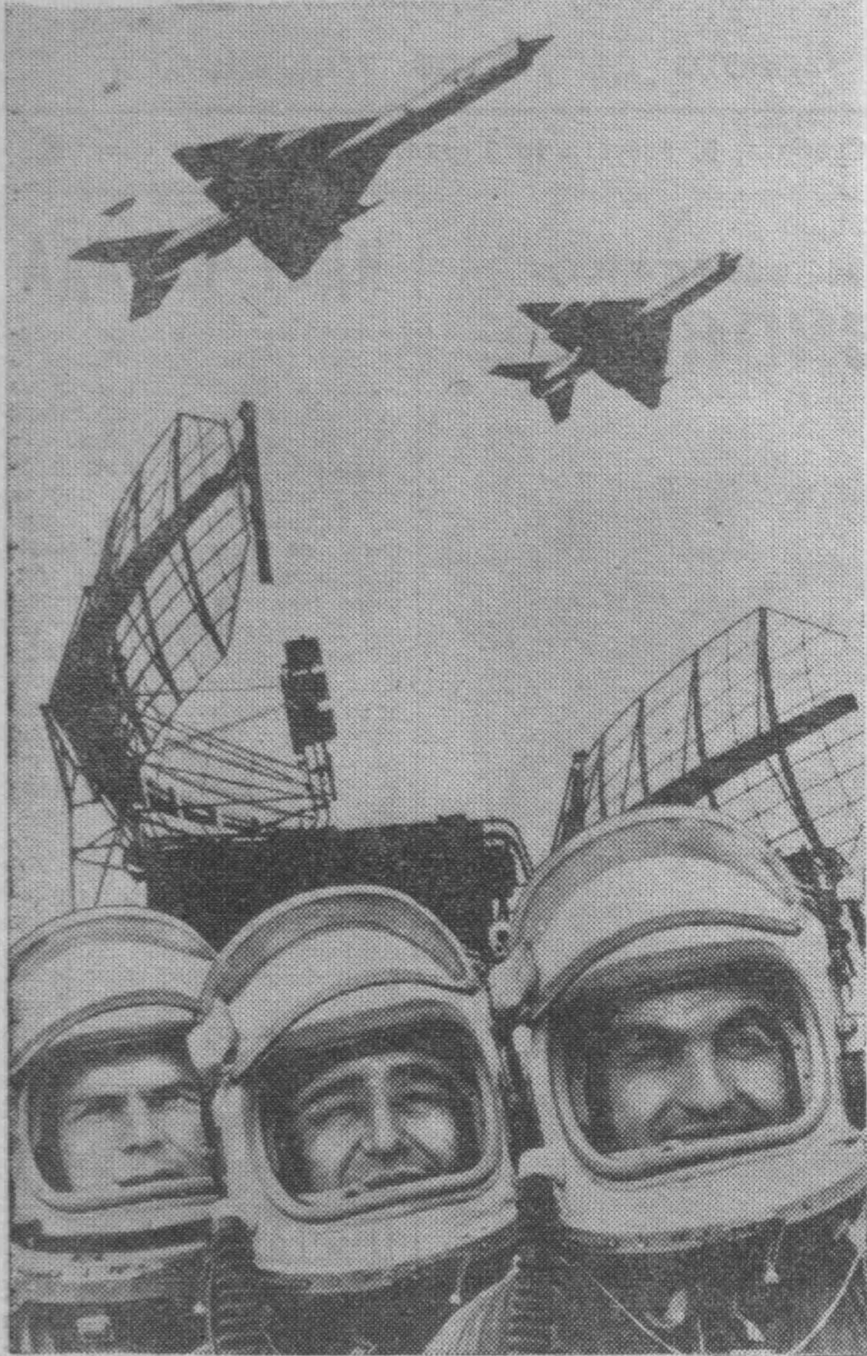
Слава советской авиации! Фотоплакат Н. Акимова (Фотохроника ТАСС).