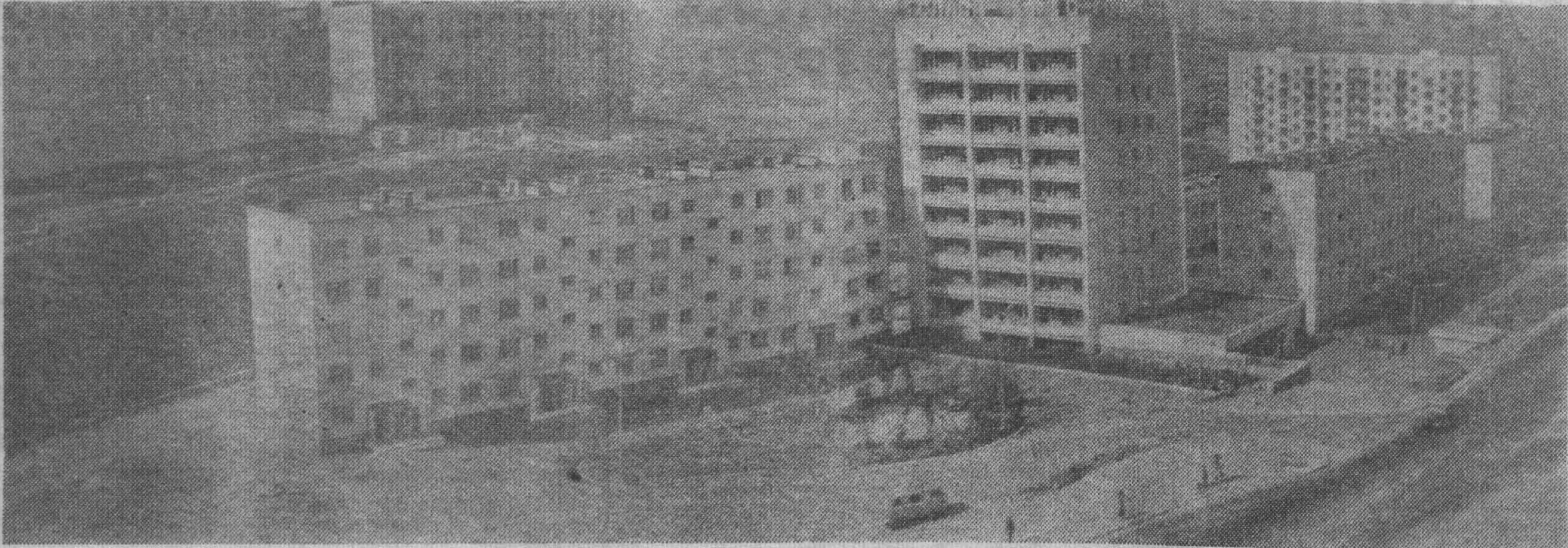
ОДНА ИЗ НОВОСТРОЕК УЛИЦЫ, НАЗВАННОЙ ИМЕНЕМ ПЕРВОГО КОМАНДУЮЩЕГО СЕВЕРНЫМ ФЛОТОМ — К. И. ДУШЕНОВА.

Теперь это стал один из лучших кварталов города. Хорошо найдено, например, место 9-этажного дома с почтой. Он — главный акцент композиции, начало улицы. Удачно решился и угол квартала с овощным магазином, который украшает декоративная подпорная стенка из того же бута. Здесь, на углу с улицей Кирова, сооружен первый подземный переход. Причем, используя особенности рельефа, нам удалось так сделать его, что вход с улицы Кирова находится на уровне тротуара (тот случай, когда пешеходу явно проще пройти по тоннелю, чем взбираться на проезжую часть, рискуя жизнью). Этот прием мы использовали и при проектировании второго перехода на строящейся площади в районе пересечения улиц