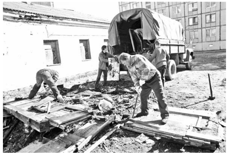
Развалить курятник добровольцев не нашлось - на помощь пришли сотрудники ТЦ «Арктический».