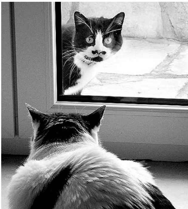
Как правило, кошачье любопытство все-таки берет верх над агрессией.

Отправляясь в отпуск, многие берут домашних питомцев с собой. А если у родственников или знакомых, к которым вы собираетесь, тоже есть пушистые любимцы? Вероятность того, что животные не поладят, велика. Особенно неуживчивы кошки.