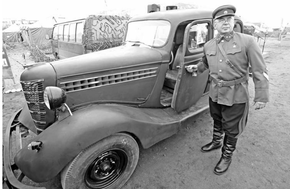
Легендарный автомобиль ГАЗ-М-1 («эмка») прибыл в Долину Славы своим ходом. Фотографии с ним привезли домой сотни северян.