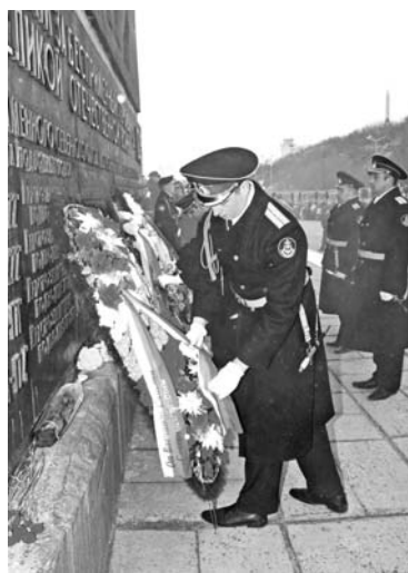
Возложение венков к памятникам - всегда торжественный момент.