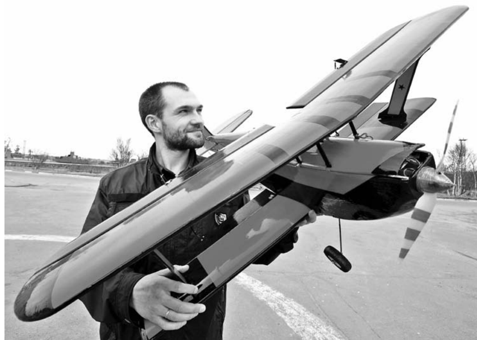
Биплан парит в воздухе 10-15 минут, а удовольствие – на весь день.