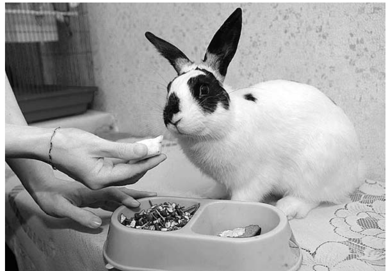
Джоник компанейский товарищ и не любит оставаться в одиночестве: куда хозяева – туда и он.

Питается кролик специальными кормами. В североморских магазинах всегда есть в продаже разнообразные смеси отечественных и импортных произво-