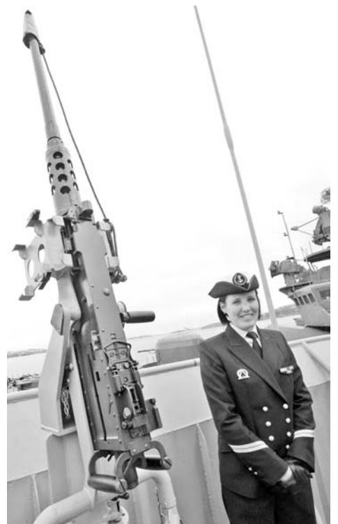
Из 218 членов экипажа фрегата 45 - женщины.