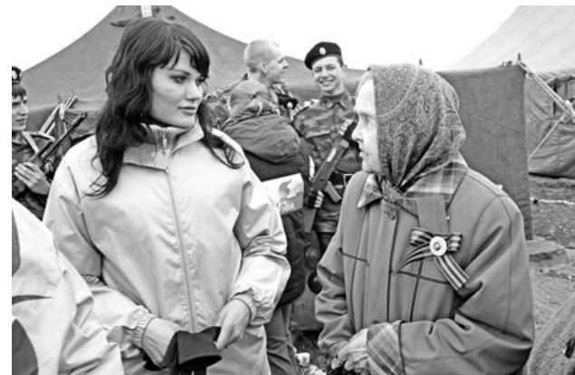
Весь день североморских ветеранов опекали волонтеры.

Анастасия ЧЕРНИКОВА.