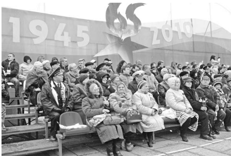
Ветеранам - заслуженный почет: они наблюдали за парадом со специальных трибун. Такое внимание многих растрогало.