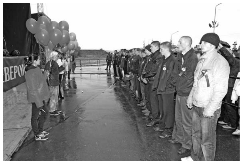
Для всех североморских ребят армия - путевка в жизнь. Но родные и подруги призвынников сдержать слез не могли.