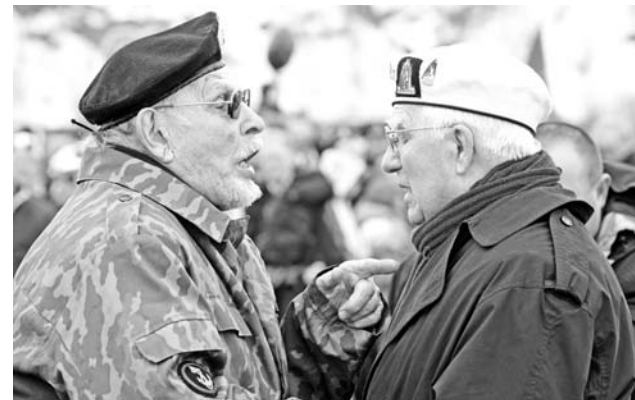
Встреча ветеранов-союзников: бойцы вспомнят минувшие дни...