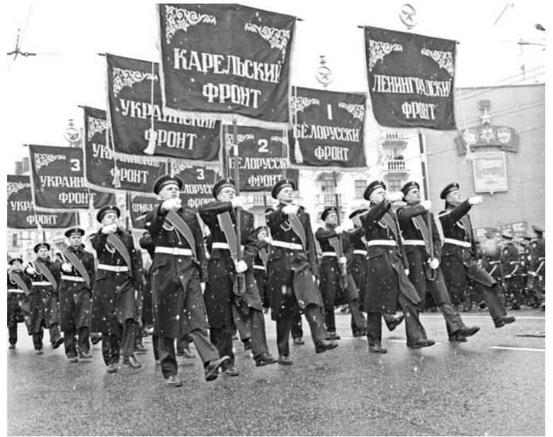
В мурманском параде 9 Мая прошли 1785 военнослужащих, сотрудников МЧС, МВД и ФСИН.

Ангела КОЛЯДА.