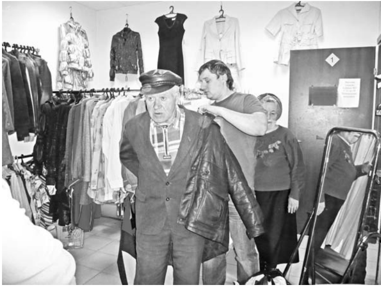
Надевать обновку всегда приятно. А когда она подарок - вдвойне.