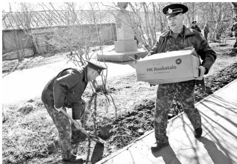
Идеальный порядок у бюста Б.Сафонова в Авиагородке навели военнослужащие в/ч 49324.

Анастасия ЧЕРНИКОВА.