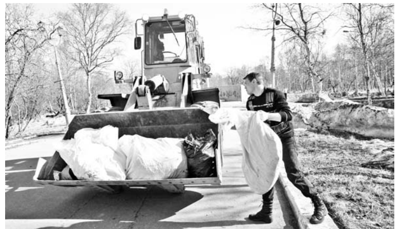
Машины «Автодорсервиса» все субботники сновали по ЗАТО, вывозя мусор за пределы города.