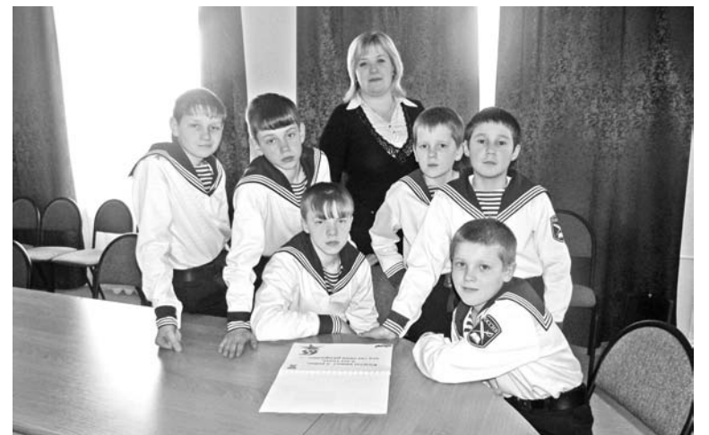
Для юнкоры школы-интерната, которые брали интервью у ветеранов, война открылась новой стороной.