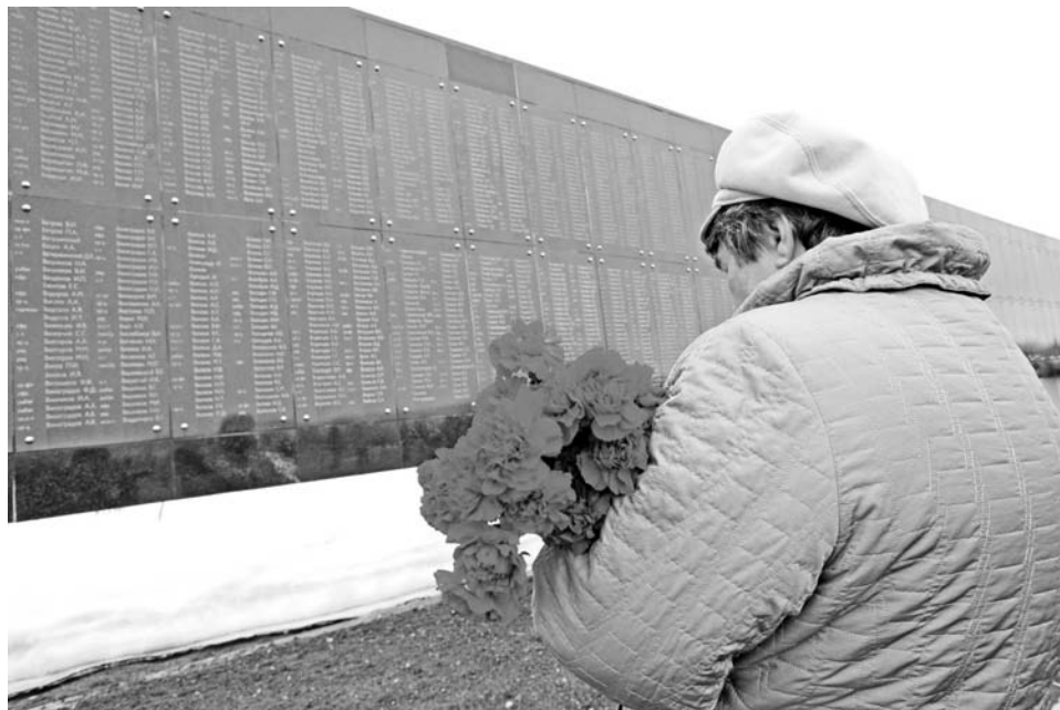
Склоняя голову перед бессмертием героев... Минута молчания у мемориальной стены.