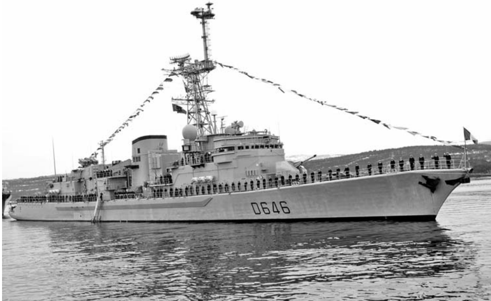
Фрегат управляемого ракетного оружия «Латуш Тревиль» был последним в серии из семи кораблей-противолодочников.