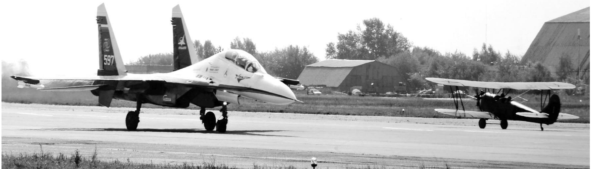
Историческая встреча современного истребителя и легендарного По-2 в Музее бронетанкового вооружения и техники в подмосковной Кубинке.