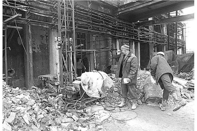
Работа по замене газоходов и боровов на 46 ТЭЦ идет полным ходом.

Готовясь к зиме, теплоэнергетики учли и замечания жителей, жалующихся на качество горячей воды в нижней части города и