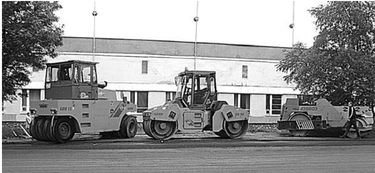
Технику пригнали еще в начале недели, ждали погоды.