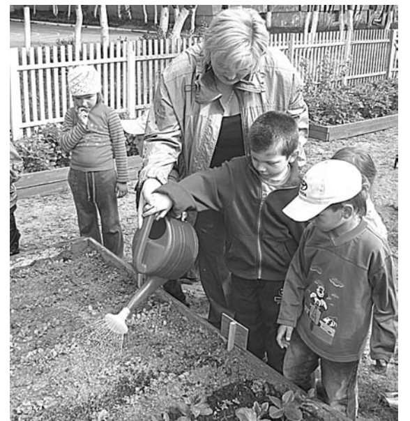
Детский сад №14 не раз становился призером конкурса-смотра учебно-опытных участков.