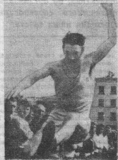
НА СНИМКАХ: финиш женской эстафеты 4 x 100; Р. Хузаитов совершает прыжок в длину.