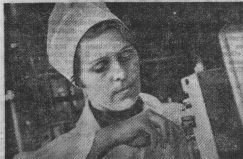
Североморский молокозавод — это современное, высокоавтоматизированное предприятие, где многими технологическими процессами управляет автоматика.