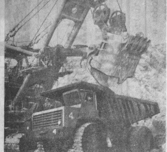
ОРДЕНОВ ЛЕНИНА И ОКТЯБРЬСКОЙ РЕВОЛЮЦИИ ОБЪЕДИНЕНИЕ «АПАТИТ» — САМОЕ КРУПНОЕ ПРЕДПРИЯТИЕ В МИРЕ ПО ПРОИЗВОДСТВУ АПАТИТОВОГО КОНЦЕНТРАТА.