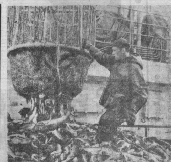
ПЯТУЮ ЧАСТЬ УЛОВЫ РЫБЫ В НАШЕЙ СТРАНЕ ДАЕТ МУРМАН.