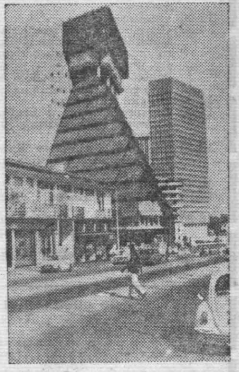
Абиджан — столица Республики Берег Слоновой Кости — считается одним из крупнейших и красивейших городов Западной Африки. Сейчас в нем проживает 850 тысяч человек. НА СНИМКЕ горожанки; на одной из столичных улиц.