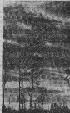
Фотоэтиюд «Тундра» В. ГОРОШКО.

Принято величать нашу северную природу суровой: суровый край, прекрасная суровая красота. Этот эпитет на расстоянии создает впечатление недоступности. Сопки. Они покрыты сне- гом с октября по май. Тундра в это время молчалива, задумчива. Ни крики птиц, ни жужжанье насекомых — ничего не нарушает тишины. Здесь полноправные владели- цы Снежной королевы Ан- дерсена. Целая армия ее подчинения налицо: грозные генералы Ураганы, посыла- ющие в бой свои бесконеч- ные ветерные войска; мар- шал Мороз, заставляющий всех и все сдвигиваться, пря- таться; а если к нему при- соединяется еще его помощ- ник Штурм, то кажется — нет силы, способной противो- стоять им; нет силы, способ- ной вернуть на небо сол- нышко, а земле — тепло и зелень.