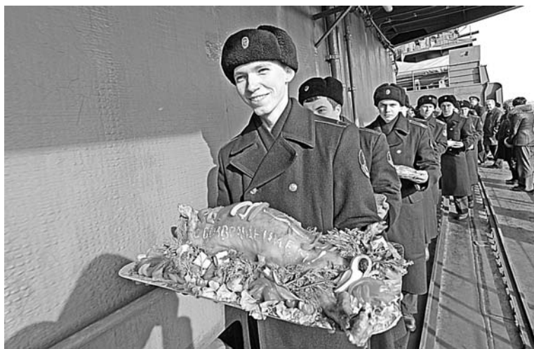
По давней традиции экипажу, успешно выполнившему задачи, вручили жареного поросенка.

Цветы, шары, улыбки, счастливые лица – вчера на причале североморской военной базы родные и близкие встречали БПК «Адмирал Чабаненко», экипаж которого отсутствовал дома почти полгода.