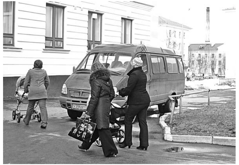
Оставленный на тротуаре автомобиль «съедает» львиную долю пространства, предназначенного для движения пешеходов.