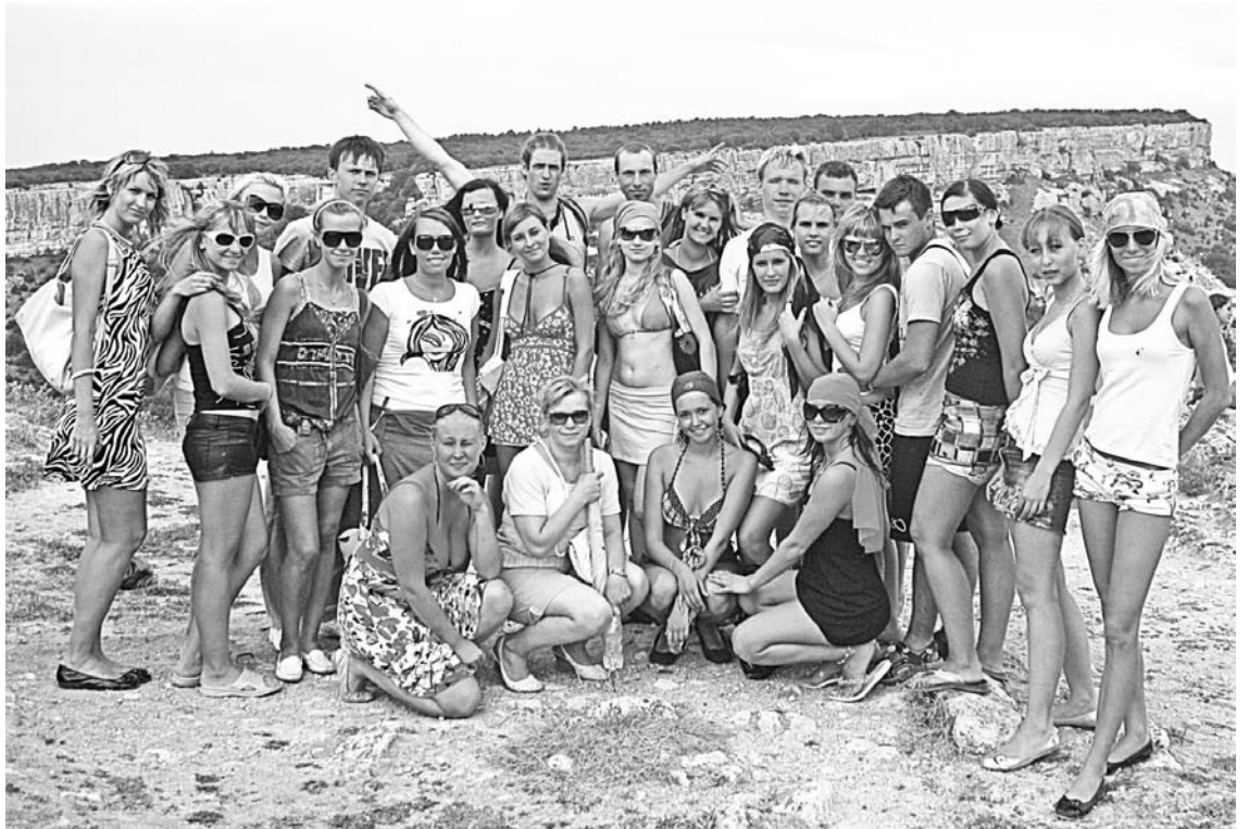
Студенты КФ ПетрГУ на отдыхе в Крыму, 2009 год.

ются позитивными эмоциями на целый учебный год, а еще это возможность завести новые интересные знакомства со студентами других вузов от Москвы до Нижнего Тагила!