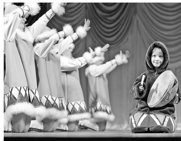
Танцем «Северные мотивы» маленький шаман из ансамбля «FUSION», будем надеяться, вызывал весну.

ступающих, были не готовы. Удивленный гул зала возымел свое действие. По окончании отделения хореографии и художе-