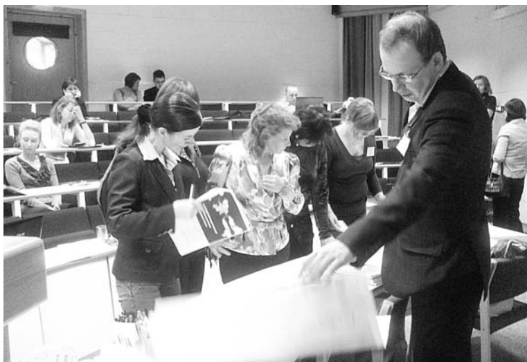
От Киотского договора и Копенгагена к Сванховду: разработана программа действий по уменьшению выбросов CO 2 .