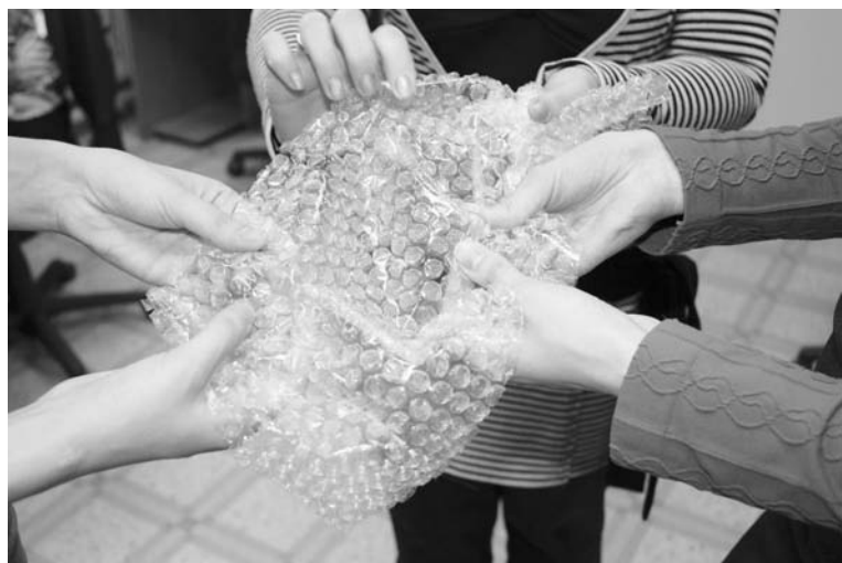
Думаете, чикимания – это выдумка? Стоит лопнуть пару пузырьков, чтобы понять, что это не так.

Елена ЯКУНИНА, Ирина ПАЛАМАРЧУК.