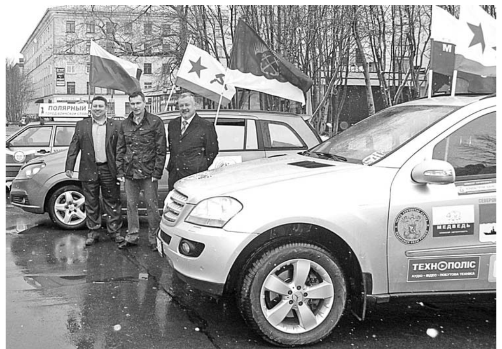
Североморцы не предполагали, что стартовать придется в штормовую погоду. Но шквальный ветер и снег не смогли помешать началу автопробега «Победили вместе».