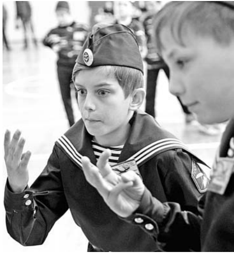
Не уверен - не подсказывай!