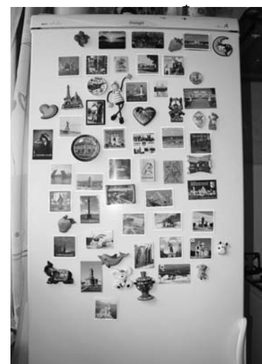
В XXI веке холодильник из обычной бытовой техники превратился в домашнее выставочное панно.