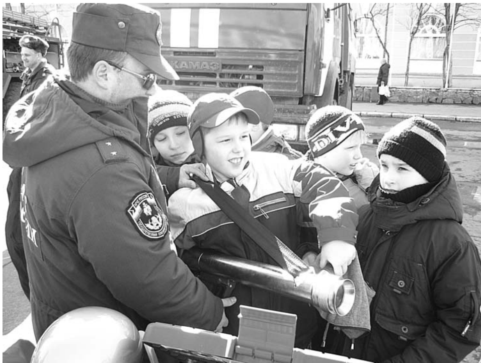
На выставке пожарной техники, которая прошла 27 апреля, любой желающий мог почувствовать себя огнеборцем.

Записала И.АЛЕКСАНДРОВА.