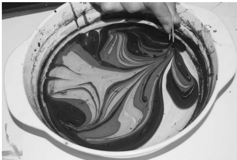
Чем больше цветов, тем интересней узор.

Подготовила Анжела КОЛЯДА.