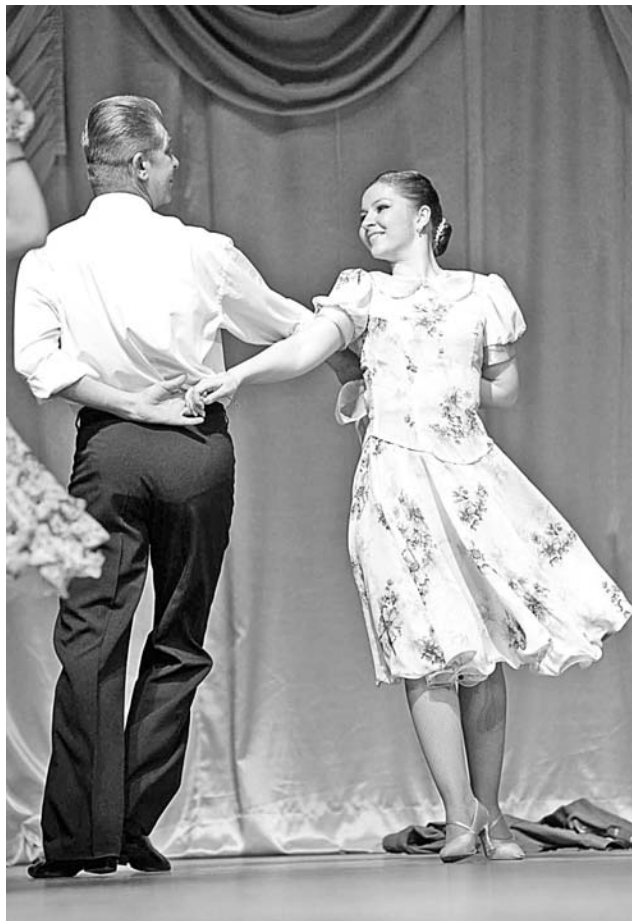
В преддверии 9 Мая «Прифронтовой вальс» смотрелся особенно трогательно.

25 апреля в ДК «Строитель» прошел городской разножанровый фестиваль-конкурс художественного творчества «Город открытых сердец», посвященный 65-летию Победы в Великой Отечественной войне.