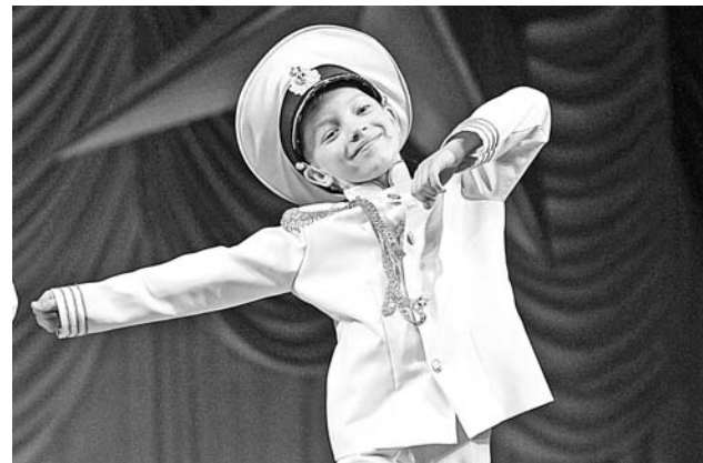
Будущий адмирал из «Каблучка» исполнил «Флотские забавы».

Жюри, переняв манеру центральных конкурсов, после завершения первого отделения фестиваля высказало участникам свое мнение. Одних похвалили за пение, других – за сценические костюмы, третьим указали на ошибки и попросили избегать их впредь. Но к подобным экспериментам зрители, а точнее их большая часть – родители вы-