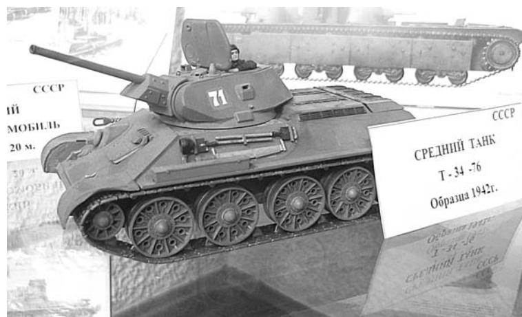
Модели бронетехники Олега Пантелеева представлены на выставке в городской библиотеке на ул.Фл.Строителей.

По материалам Интернет-сайтов И.АЛЕКСАНДРОВА.