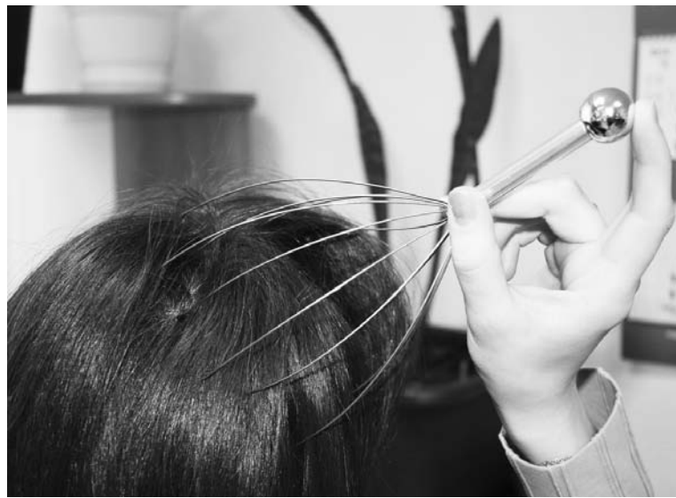
«Мурашка Антистресс» поможет снять напряжение прямо на рабочем месте.

Офисный вариант релаксации – массажер «Мурашка Антистресс». Одновременное скольжение наконечников из натурального латекса по коже головы стимулирует капиллярный кровоток, за счет чего усиливается насыщение клеток активным кислородом. При этом расслабляются мышцы головы, снимается напряжение, улучшается состояние волос и их рост, наступает состояние общего расслабления и покоя, стихает боль. Идея капиллярного массажера была заимствована из восточной медицины, где с древних времен практи-