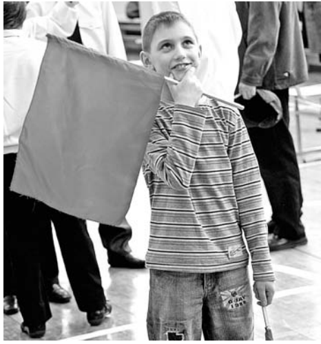
Ох, нелегкая это работа - флажный семафор!

В третьей номинации - «Морские пехотинцы» - капитаны команд демонстрировали свои навыки. Эстафета включила в себя вязание морских узлов,