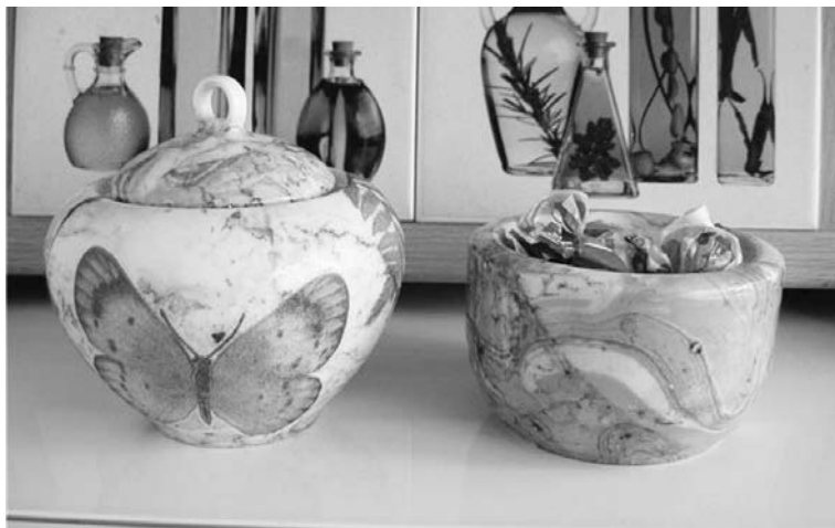
Мраморированную посуду можно украсить декупажем: приклеить вырезанную из бумажной салфетки бабочку.

После поставьте свой шедевр на лист бумаги. Оставшуюся воду с краской просто так выливать