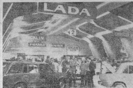
Швейцария. Автомобили Волжского автозавода «Лада» («Жигули») пользуются большим успехом на 46-м Женевском автосалоне, где демонстрируют свою продукцию 86 крупнейших автомобильных фирм из 26 стран мира.

НА СНИМКЕ: «Лады» на Женевском автосалоне.