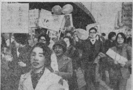
Япония. Основные классовые бои японских трудящихся, начавших свое традиционное весеннее наступление в защиту экономических и политических прав, еще впереди, но уже сейчас не проходит дня без митингов и демонстраций.

НА СНИМКЕ: «Лады» на Женевском автосалоне.