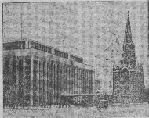
Москва. Кремлевский Дворец съездов и Троицкая башня.