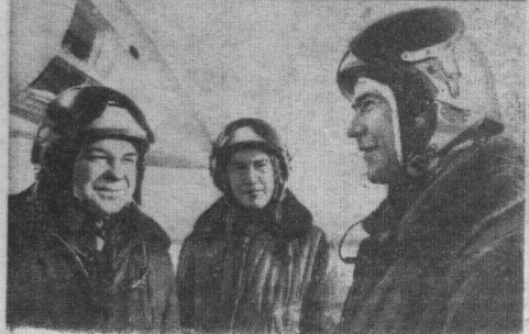
День и ночь несут боевую вахту в небе Родины авиаторы прославленных советских Военно-Воздушных Сил. Летчикам подлетная новейшая техника, которую вручила им страна.

Четыре года подряд носит звание отличной Н-ская гвардейская часть. В честь XXV съезда КПСС летчики и штурманы, инженеры и техники добиваются новых успехов в боевой и политической подготовке.