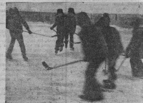
На встречных атаках.

Н. МИЛОВ, корр. ТАСС, поселок Калеваала, Карельская АССР