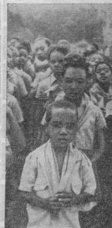
Самые юные граждане Народной Республики Конго недавно отметили десятую годовщину национального пионерского движения. Более двух тысяч школьников в торжественной обстановке были посвящены красные галстуки, подаренные им пионерией Советского Союза.

НА СНИМКЕ: школьники, принятые в пионеры.